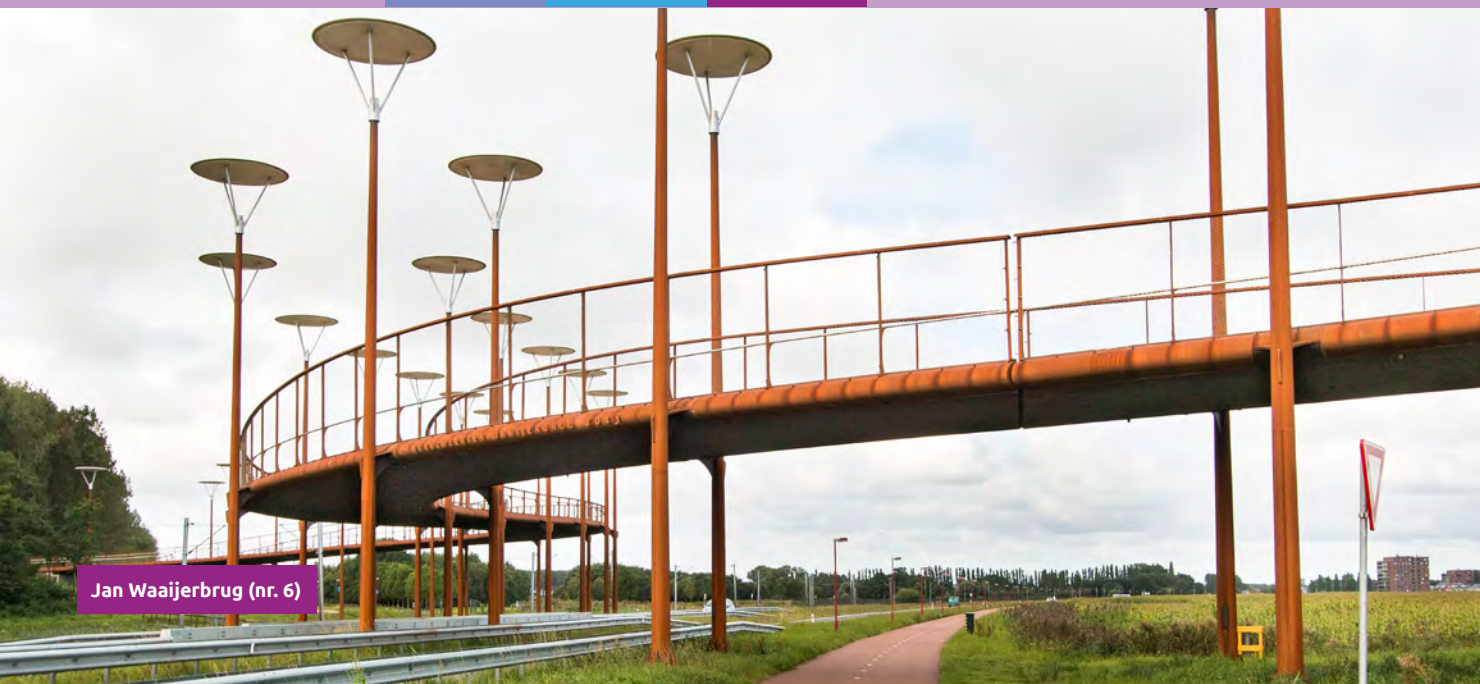
Jan Waaijerbrug (nr. 6)

De omslag in het bouwen van hoog naar laag is begonnen, in heel Nederland en zeker ook in Zoetermeer. Terwijl er tot 1974 nog volop hoogbouw tot stand kwam, komt er begin jaren zeventig ruimte voor experiment. Na een tijd van bouwen in zeer hoge dichtheden de hoogte in worden alternatieven bedacht. Wel veel woningen realiseren op een relatief kleine oppervlakte maar niet meer zo hoog gestapeld als in de galerij- en torenflats. Bovendien wordt door architecten en stedenbouwkundigen volop naar oplossingen gezocht voor het parkeren in de woonwijk en op welke wijze woonbuurten toegankelijk kunnen zijn voor verkeer. Een groeiende groep mensen bezit immers een auto. Het pleintjesplan is de kiem voor de latere zogenaamde verdwaa- of bloemkoolwijken met wegen die als de takken van een boom uitlopen op doodlopende woonpleinen. Op de route Meerzicht Laag komt de wandelaar langs experimentele woningbouw en het slingerend blauw en groen van parken met waterpartijen. Meerzicht, een prettige, afwisselende én groene woonwijk met Waters, Landen en Bergen. Aan de westzijde van deze wijk is een groot park: Het Westerpark met als zoetwaterparel de Natuur- en Landschappentuin.