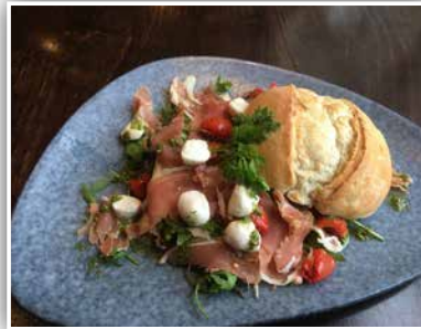
Gutes essen und trinken

Restaurationsmaler bei der Sanierung des stattlichen Gebäudes von Vorteil ist. „Wir möchten es zum schönsten Hotel machen. Dieses Gebäude hat so viele Besonderheiten. Wir arbeiten bereits hart daran, es wieder in seinem alten Glanz erstrahlen zu lassen.“ So hat beispielsweise der Speisesaal eine Metamorphose durchlaufen. Auch das Herrenzimmer, ein Lounge-Bereich mit gemütlichem Herdfeuer, wurde bereits in Angriff genommen. Joost: „Wussten Sie, dass das Herrenzimmer vor 1942 ein Pferdestall war? Bei der Renovierung des Bodens im Herrenzimmer fanden wir noch alte Hufnägel wieder. Das ist einfach toll!“ Die 20 Hotelzimmer erhalten nacheinander ein neues Aussehen. In der Zwischenzeit steht das Hotel weiterhin für Übernachtungen zur Verfügung und