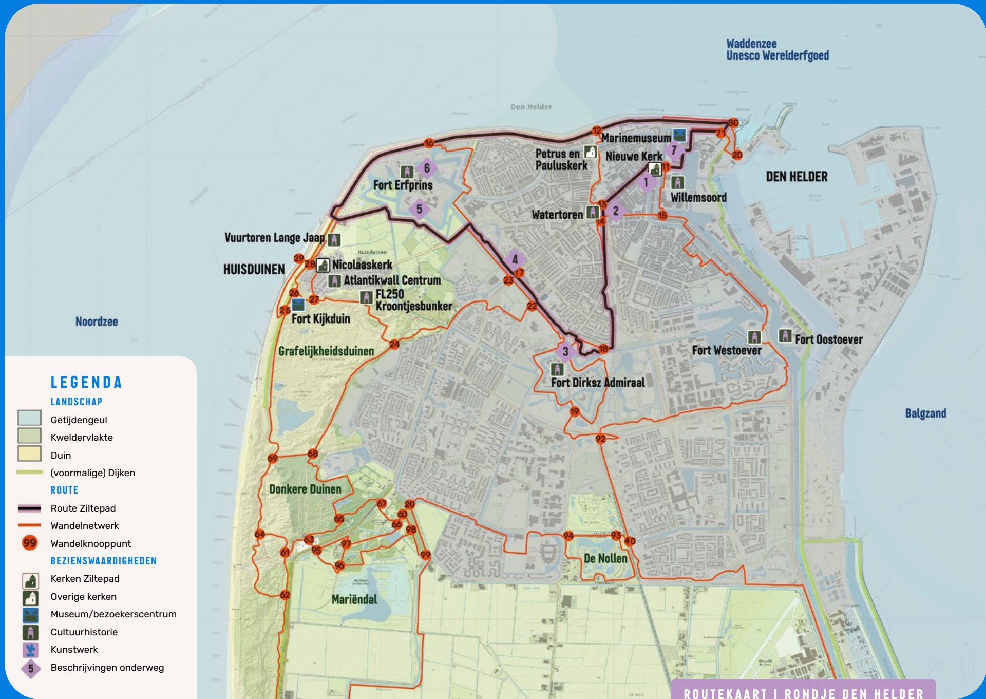
ROUTEKAART | RONDJE DEN HELDER