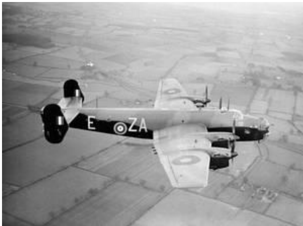
Halifax Mk II

Tijdens deze aanval gaan in totaal 17 toestellen verloren, waaronder één Halifax, type Mk II. Het is een toestel van het 51e Squadron van de RAF basis in Snaith. Na een succesvolle missie boven Berlijn wordt de Halifax neergehaald door een Duitse nachtjager. Even na middernacht, op 2 maart 1943, crasht het toestel in een akker bij de Klarenbeekseweg in het dorp Voorst. De zeven bemanningsleden komen bij de crash om het leven.