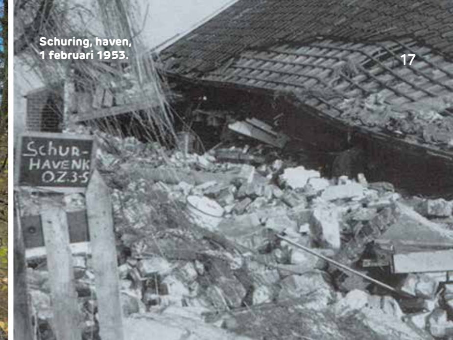
Schuring, haven, 1 februari 1953.