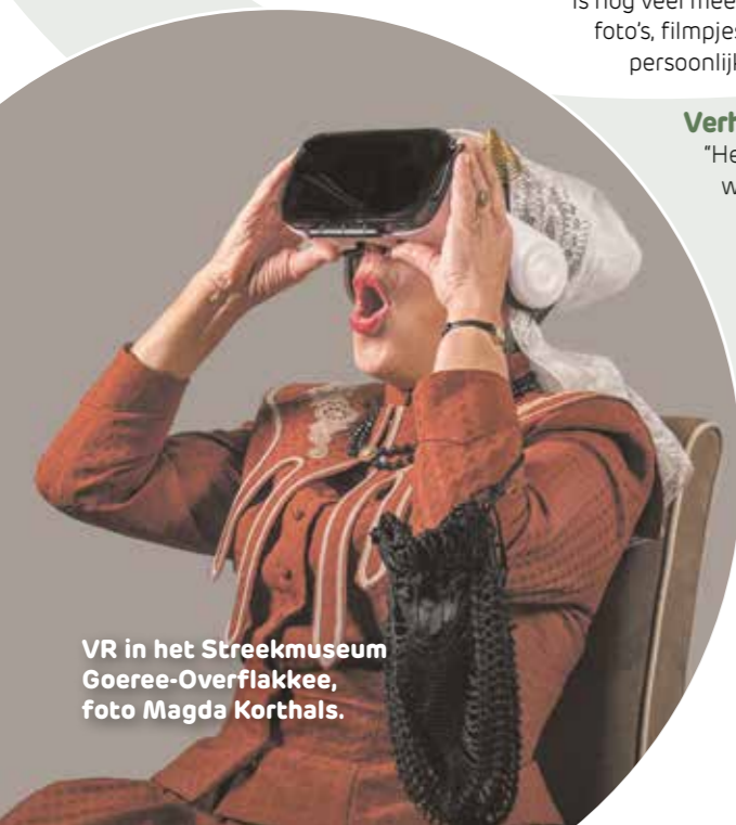
VR in het Streekmuseum Goeree-Overflakkee, foto Magda Korthals.