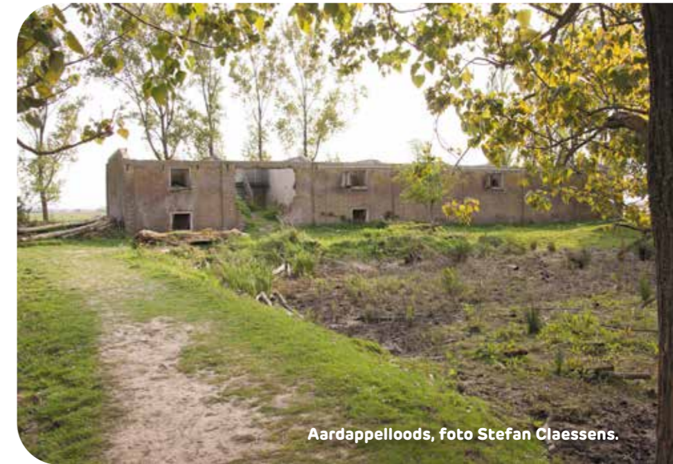
Aardappelloods, foto Stefan Claessens.

De Karantijn is inmiddels ook grotendeels vergaan. Maar het casco is er nog. Een kunstenaar heeft er een folly van gemaakt. Een herinnering aan de historie van Tiengemeten als quarantaineplaats.