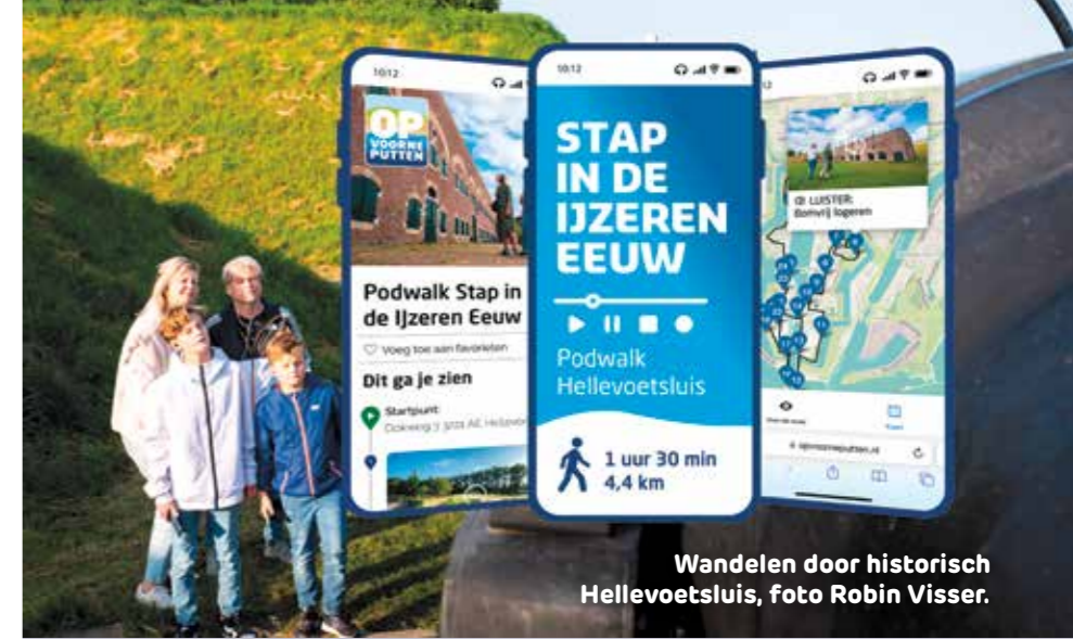
Wandelen door historisch Hellevoetsluis, foto Robin Visser.