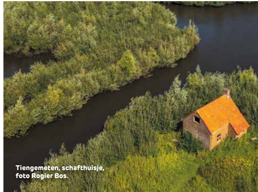
Tiengemeten, schafthuisje, foto Rogier Bos.