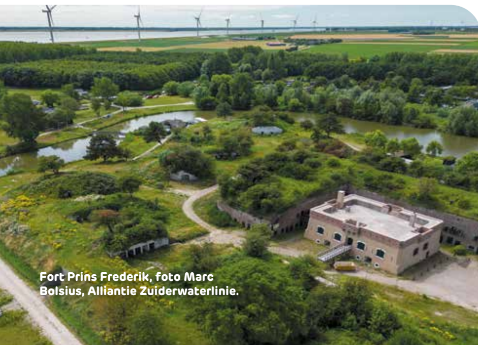
Fort Prins Frederik, foto Marc Bolsius, Alliantie Zuiderwaterlinie.

Het uiteindelijke doel is om een toeristische trekpleister te maken van Fort Buitensluis. Maar wie deze bijzondere locatie nu wil bekijken en van het prachtige uitzicht wil genieten, hoeft niet te wachten. Kijk op www.fortbuitensluis.nl voor de open dagen tussen april en oktober. Het fort is ook open als de Veerdienst Anna vaart (tussen Willemstad en Numansdorp).