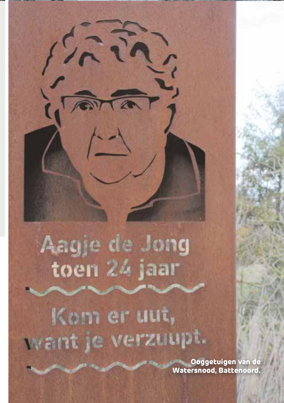
Ooggetuigen van de Watersnood, Battenoord.

De routekaarten zijn verkrijgbaar bij onder meer het VVV Inspiratiepunt in Ouddorp, Bezoek Hellevoetsluis (Marketing OP Voorne-Putten) en Natuurlijk. Hoeksche Waard.