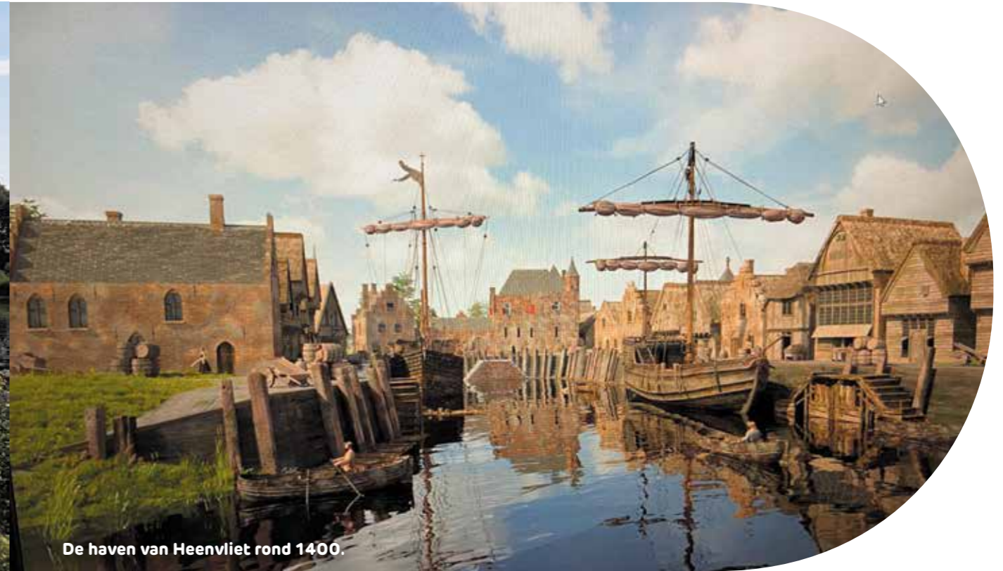
De haven van Heenvliet rond 1400.