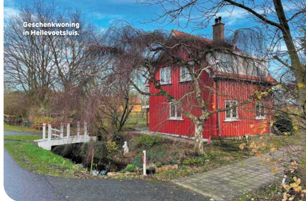
Geschenkwoning in Hellevoetsluis.