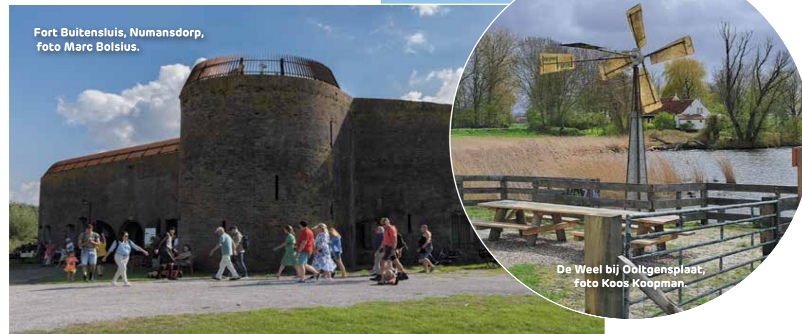
Fort Buitensluis, Numansdorp, foto Marc Bolsius.