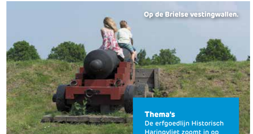
Op de Brielse vestingwallen.

Naast Historisch Haringvliet zijn er nog zes erfgoedlijnen in Zuid-Holland: Neder-Germaanse Limes, Oude Hollandse Waterlinie, Atlantikwall, Landgoederenzone, Trekvaarten en Waterdriehoek (Kinderdijk – Dordrecht – Biesbosch).