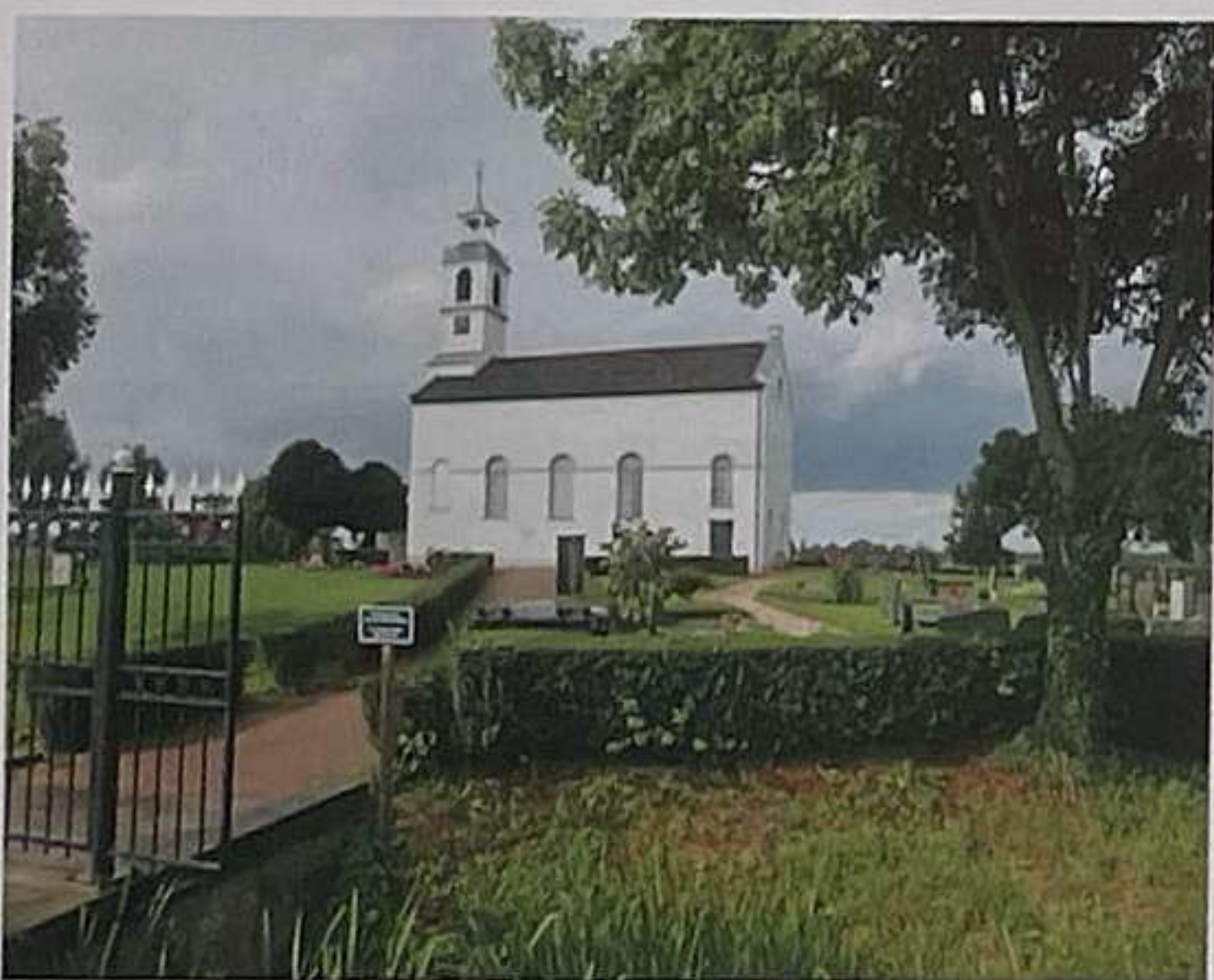
Idyllisch kerkje in Simonshaven (Bernisse)

Op https://www.opvoorneputten.nl/ vind je heel wat fietsroutes met een beschrijving en bezienswaardigheden onderweg, samen met een kaartje en het gpx-bestand dat je kunt downloaden. De meeste routes maken gebruik van het bekende knooppuntennetwerk.