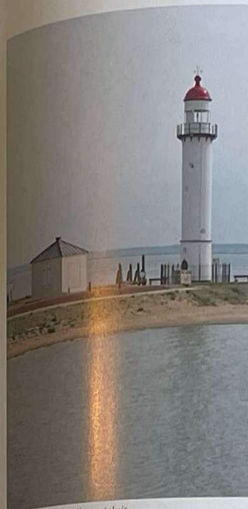
Vuurtoren in Hellevoetsluis

We fietsen daarna langs het Oostvoornse en het Brielse Meer. Europoort, de havenvlakte die de Nederlanders op de zee hebben gewonnen, wordt vakkundig uit het zicht gehouden door dijken en groene natuurschermen. We houden nog even halt aan de Stenen Baak, de eerste stenen vuurtoren van Nederland. De toren was ook strategisch van groot belang en moest vestingstad Brielle beschermen tegen vijandelijke schepen die de monding van de Maas wilden opvaren. Het goedlopende fietspad op de Heindijk leidt ons vervolgens recht terug naar Brielle. Rest ons nog een heerlijke afsluiter in het Poorter Boutique Hotel om deze korte vakantie af te sluiten.