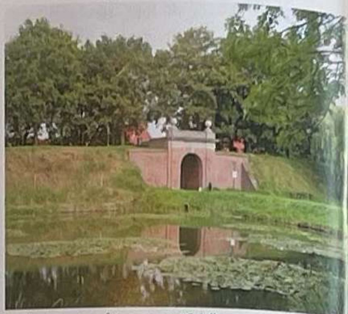
De Kaaiport geeft toegang tot Brielle

De ranke, witgeschilderde vuurtoren vierde enkele jaren geleden zijn 200ste verjaardag en werd in 2005 gerestaureerd, onder meer met fondsen van de stad en haar inwoners. Deze toren is het symbool van Hellevoetsluis. We fietsen nu langs de beboste duinrand