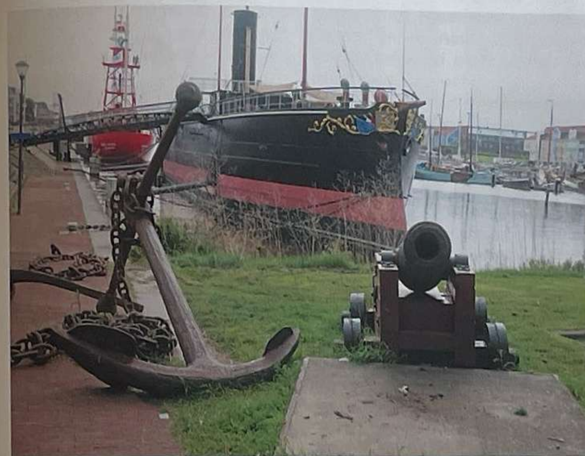
Ramtorenschip De Buffel aan de Koningskade in Hellevoetsluis

We volgen nu een enig mooi fietspad langs de Bernisse via Abbenbroek terug tot in Zuidland. Met een beetje geluk spot je onderweg één van de vele bewoners. Buizerds, fazanten, Kieviten, grutto's,