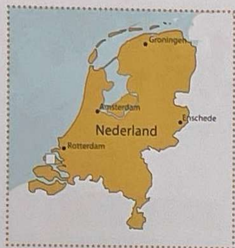
Tekst en foto's: Pol Denoo