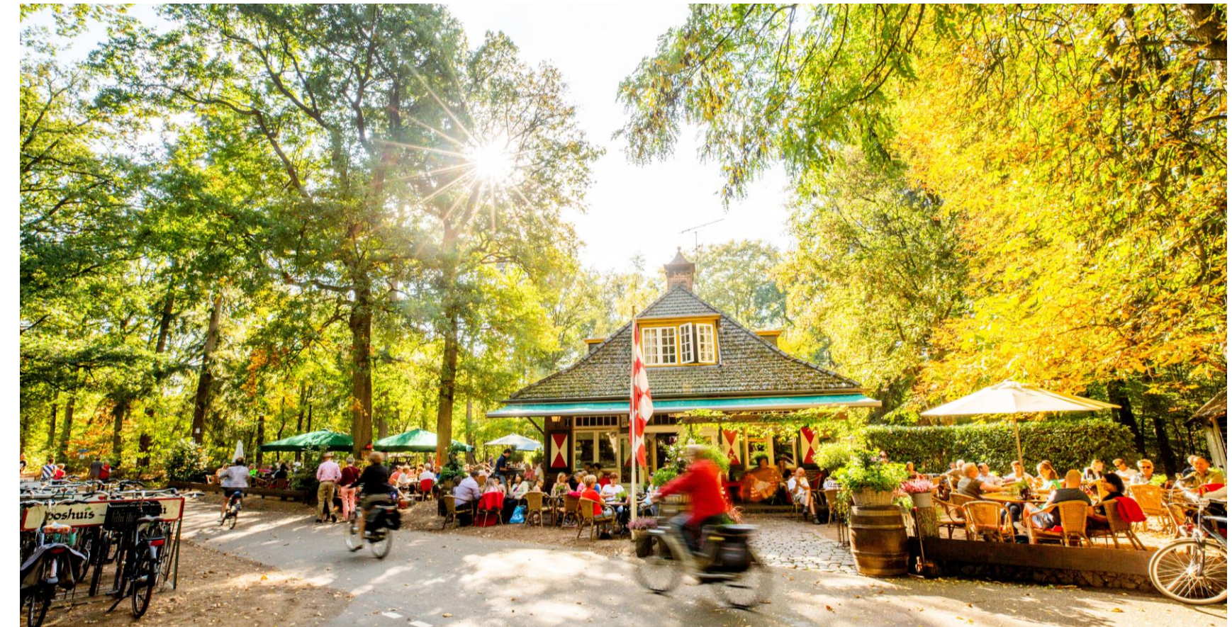
↑ Gezelligheid midden in de natuur

Om je op weg te helpen hebben we 5 foto's geselecteerd en wat deze foto's vertellen.