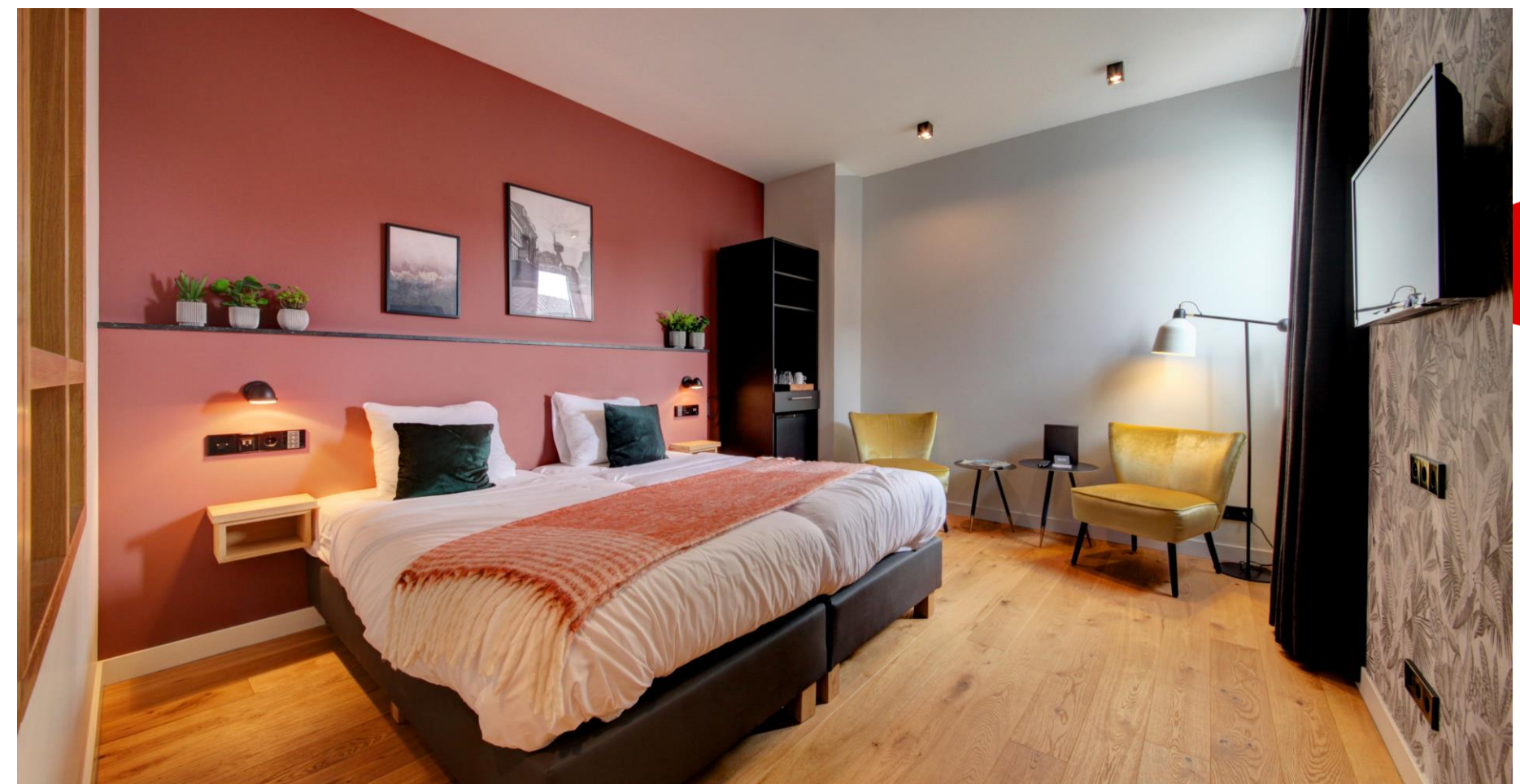
Moderne luxe ↓