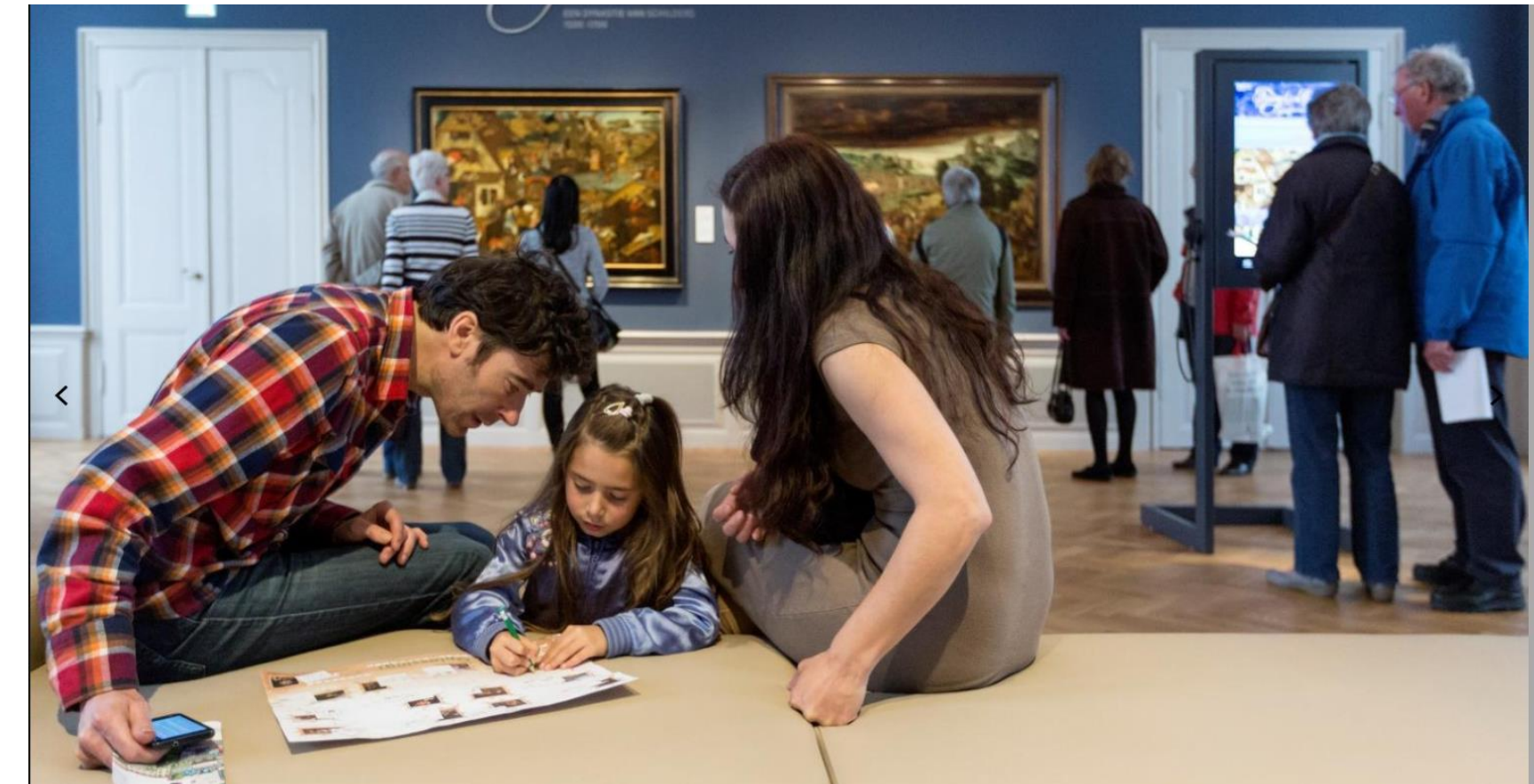
↑ Dit beeld zorgt voor sfeer en beleving