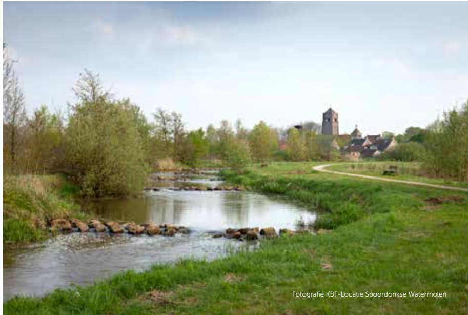
Fotografie KBF-Locatie Spoordonkse Watermolen