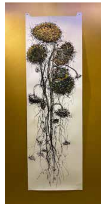
Expositie 'Zonnebloemen voor Van Gogh', Vincent van GoghHuis, Zundert