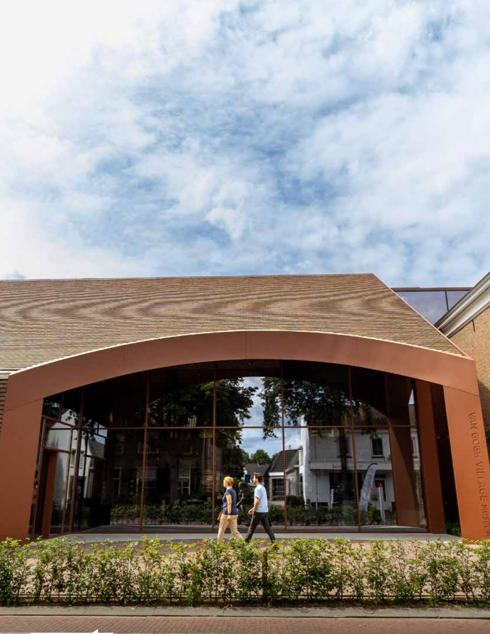
Van Gogh Village Museum, Nuenen