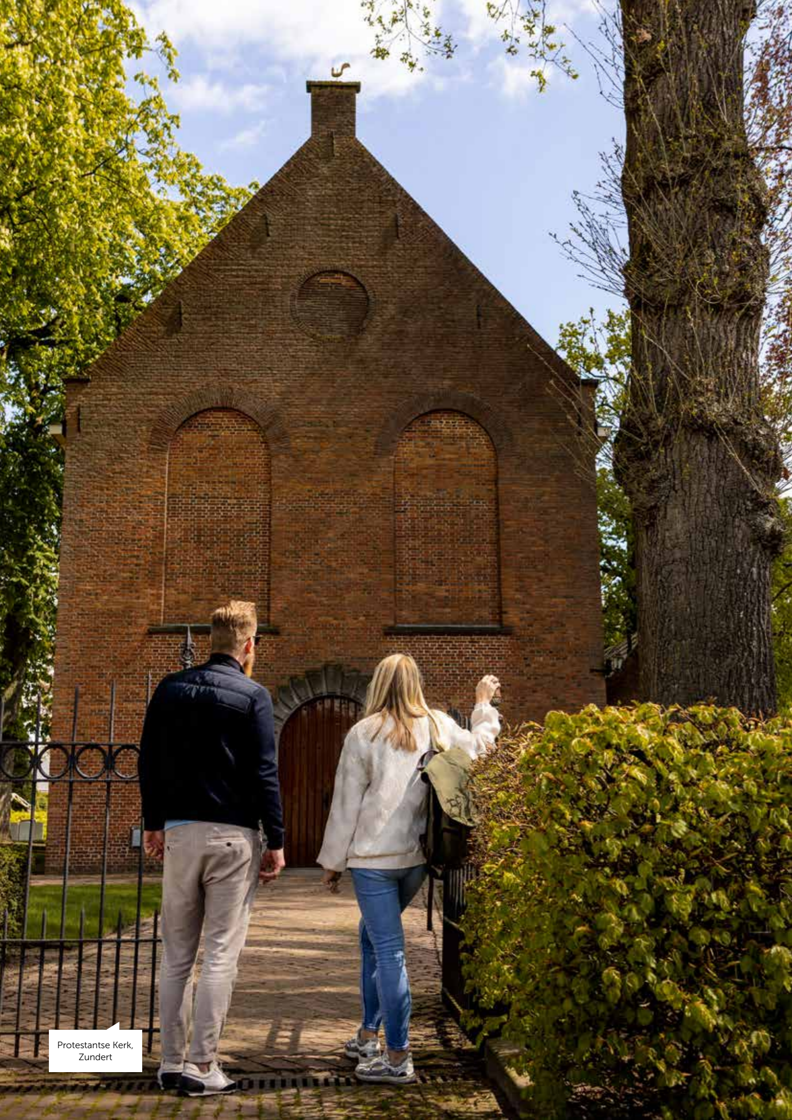
Protestantse Kerk, Zundert