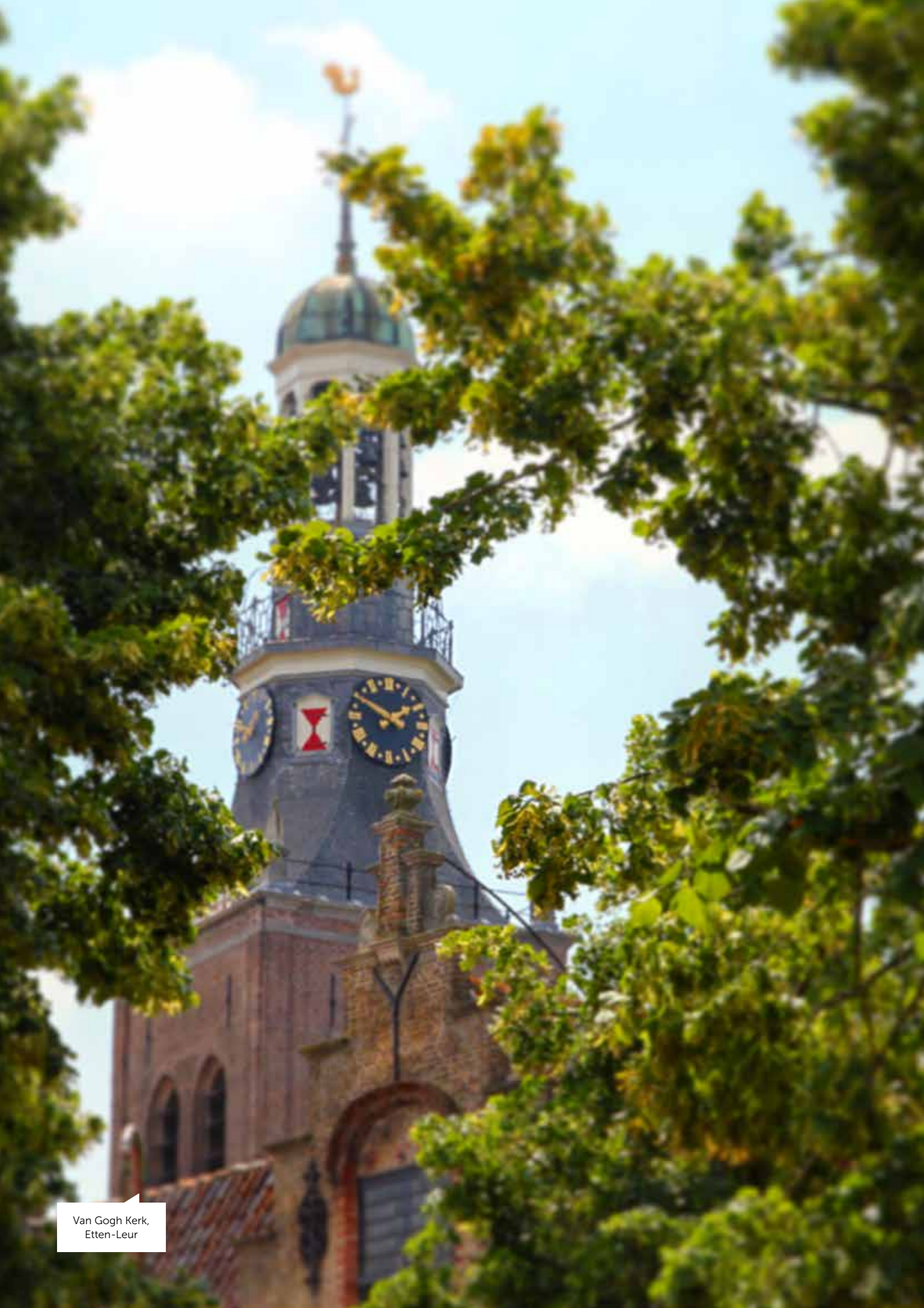
Van Gogh Kerk, Etten-Leur