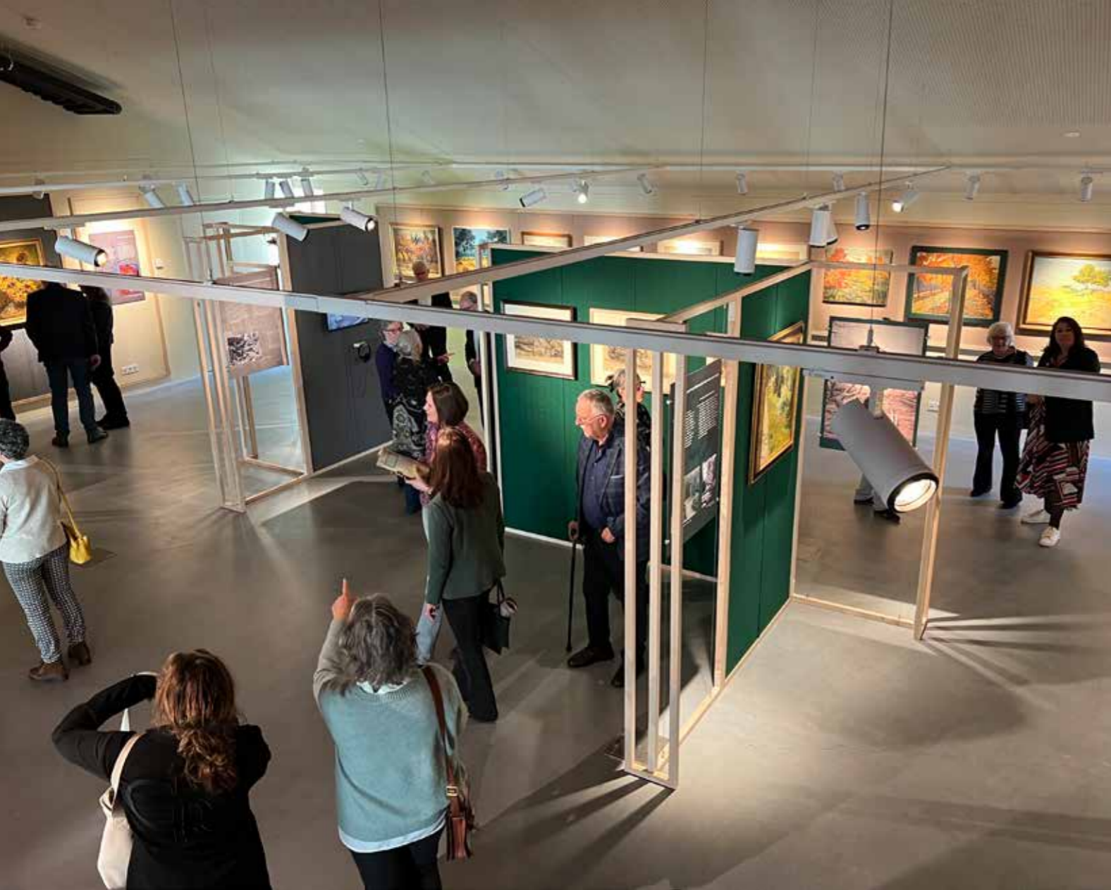
Expositie 'Van Gogh Achterna', Henri van der Waals