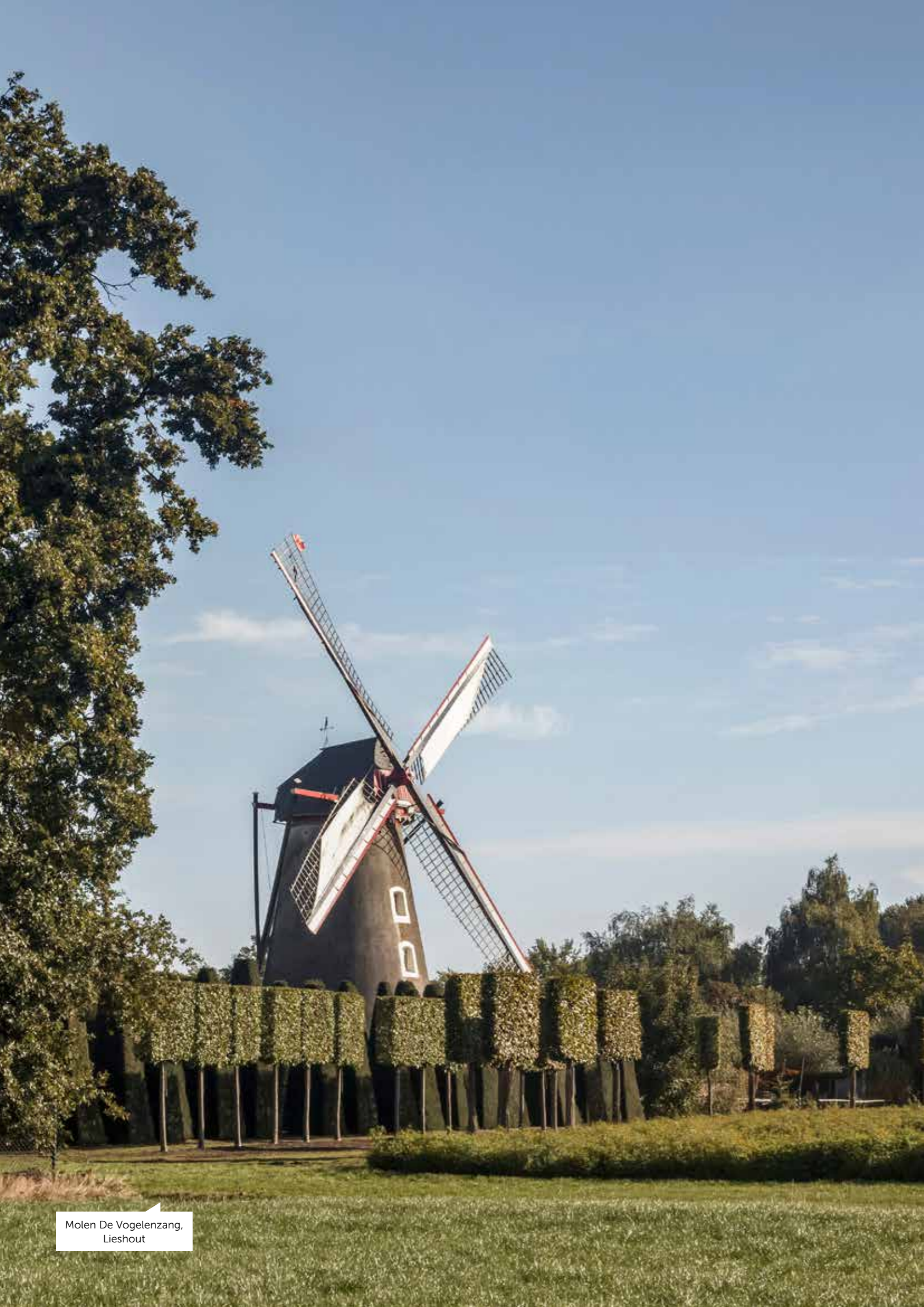
Molen De Vogelenzang, Lieshout