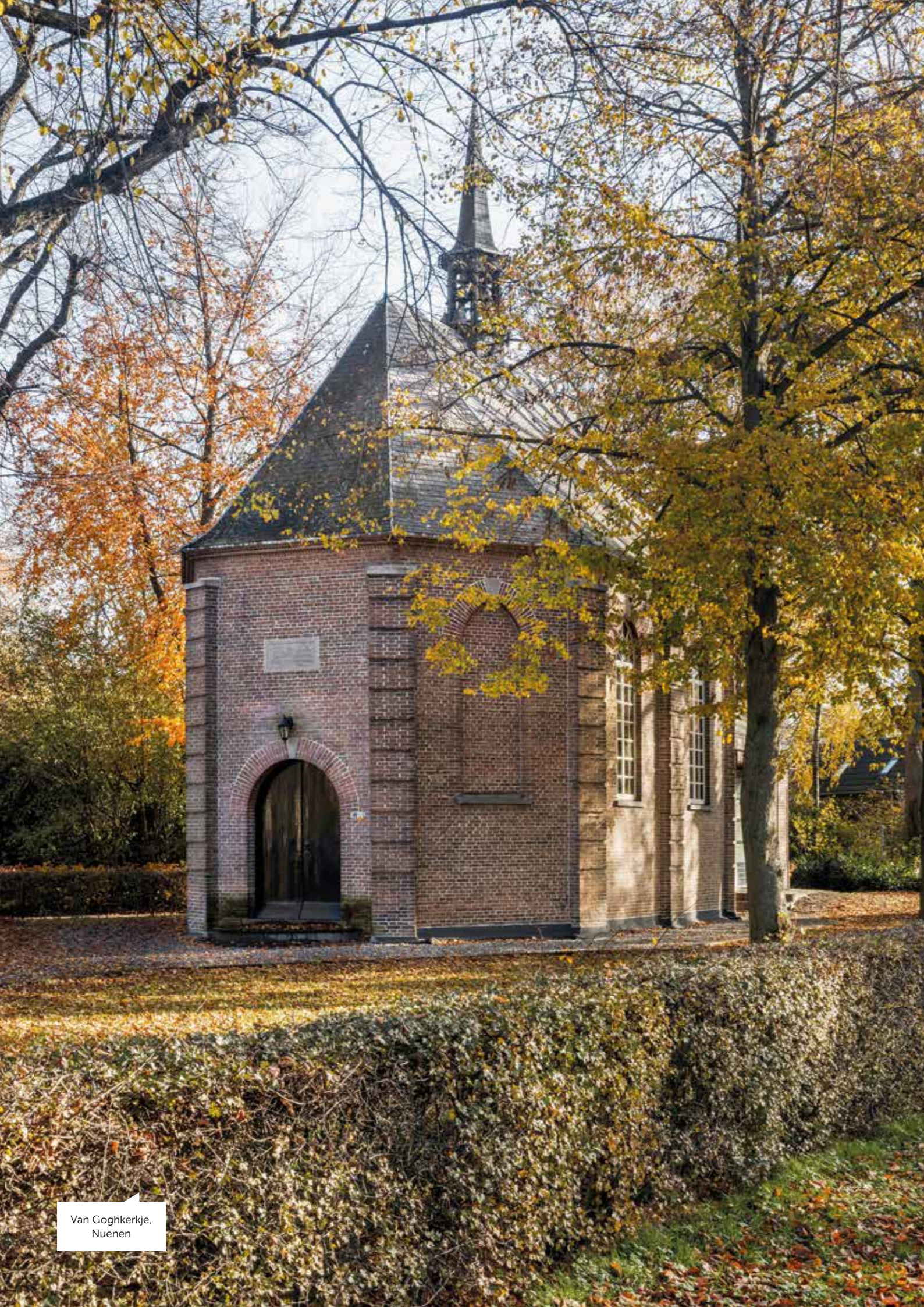
Van Goghkerkje, Nueneen

"Ik geloof dat we tegenwoordig de rijke en prachtige aspecten van de natuur moeten schilderen; wij hebben behoefte aan vreugde en geluk, aan hoop en liefde."