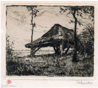
Schuur te Nuenen, ets Nico Eekman, Nuenen, 1918