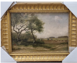
Aardappelrooisters op het Brabantse land, Anton Kerssemakers, olieverf op doek, z.j.