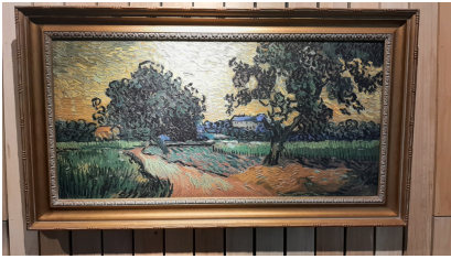
Replica van Landschap bij avondschemering

De ontvangst heeft in juni 2023 plaatsgevonden. Deze relievo is opgenomen in de administratie van het Kunstfonds.