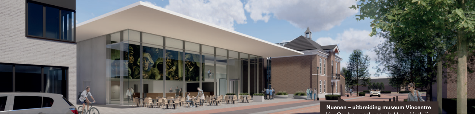
Nuenen – uitbreiding museum Vincentre Van Gogh op zoek naar de Mens. Voel zijn ontwikkeling tot meesterschap.