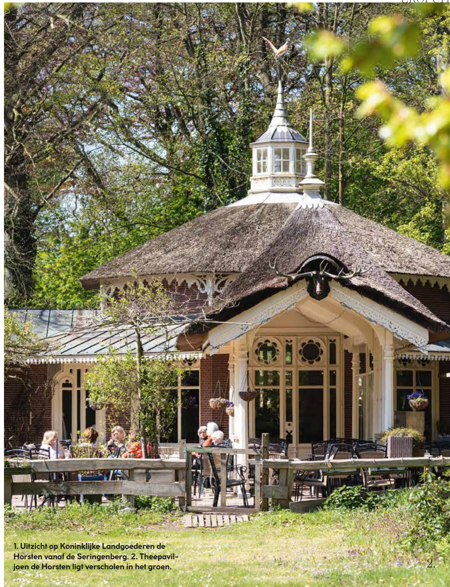
1. Uitzicht op Koninklijke Landgoederen de Horsten vanaf de Seringenberg. 2. Theepaviljoen de Horsten ligt verscholen in het groen.