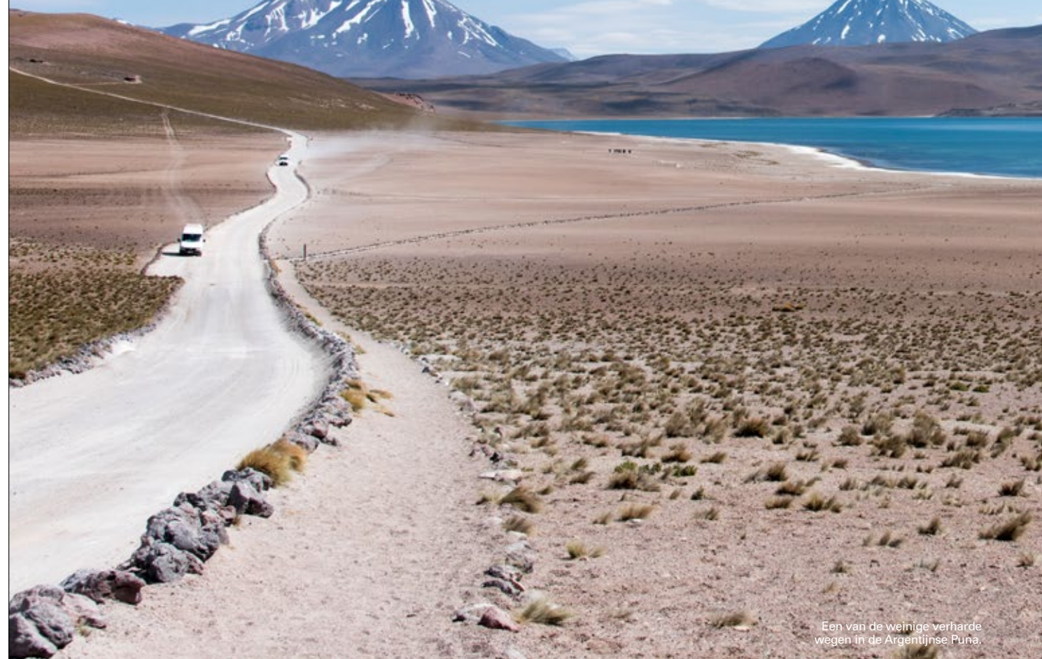
Een van de weinige verharde wegen in de Argentijnse Puna.

Daar waar de bergkammen van de Andes openen en het surrealistische landschap ieder uur verandert: de Argentijnse Puna, een hooglandwoestijn in het noordwesten van Argentinië, blijft verbazen.