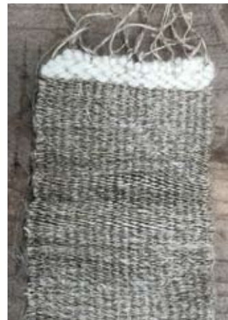
vlasteelt op de Hortus en eerste stukje linnen