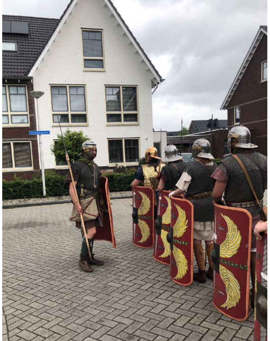
beeldverhaal Romeinendag Bodegraven, Romeinse re-enactors in nieuwbouwwijk Weideveld