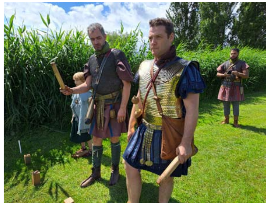
beeldverhaal Romeinendag Bodegraven op de Hortus Populus