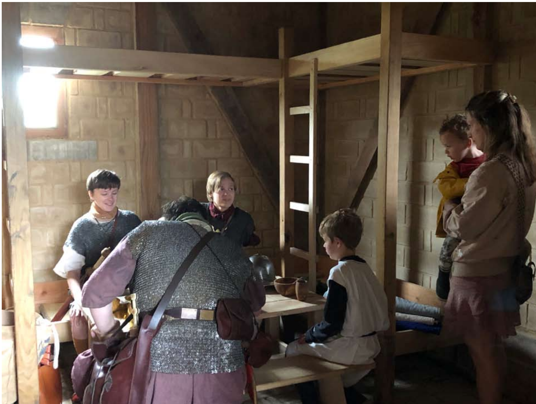
beeldverhaal Romeinendag Bodegraven, Romeinse re-enactors en bezoekers in de soldatenbarak