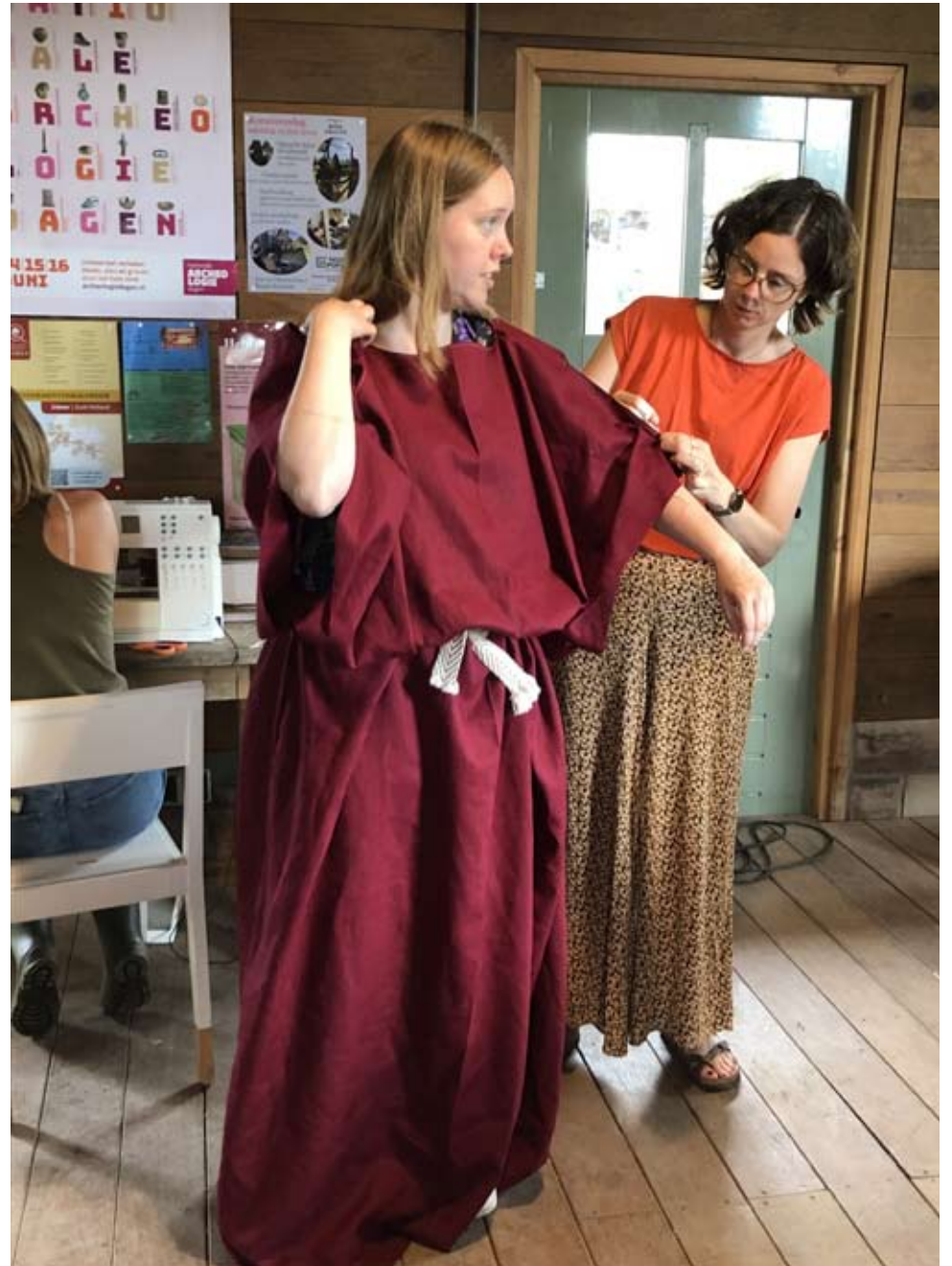
beeldverhaal Romeinse tunica maken workshop