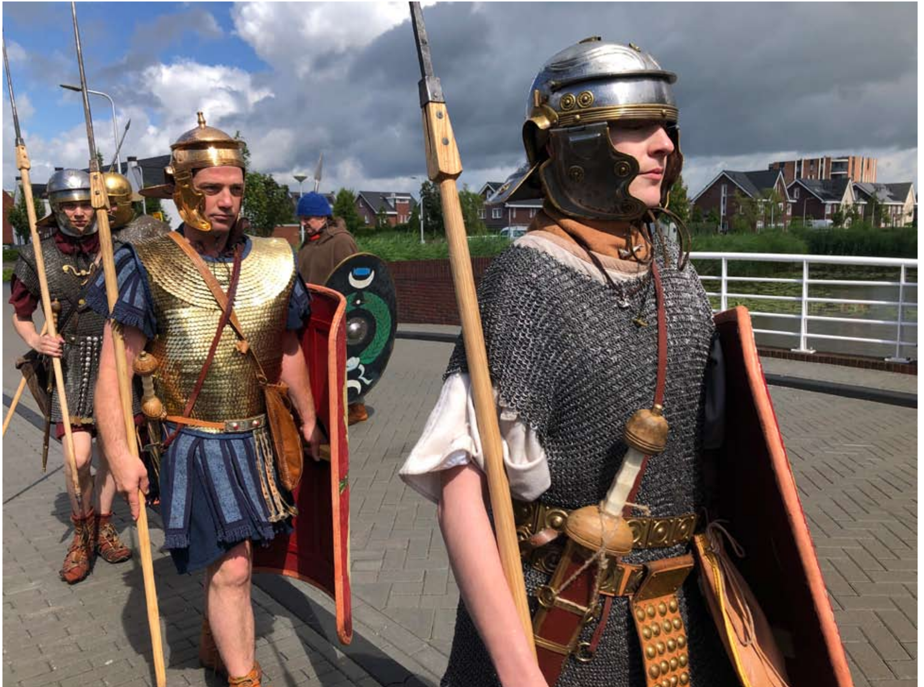
beeldverhaal Romeinendag Bodegraven, Romeinse re-enactors in nieuwbouwwijk Weideveld