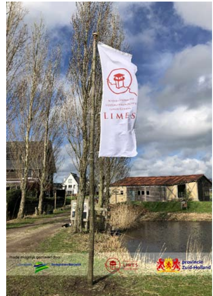
De Limesvlag waait in het Limespark