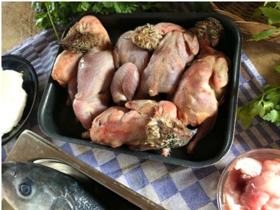
beeldverhaal Romeinse kookworkshop