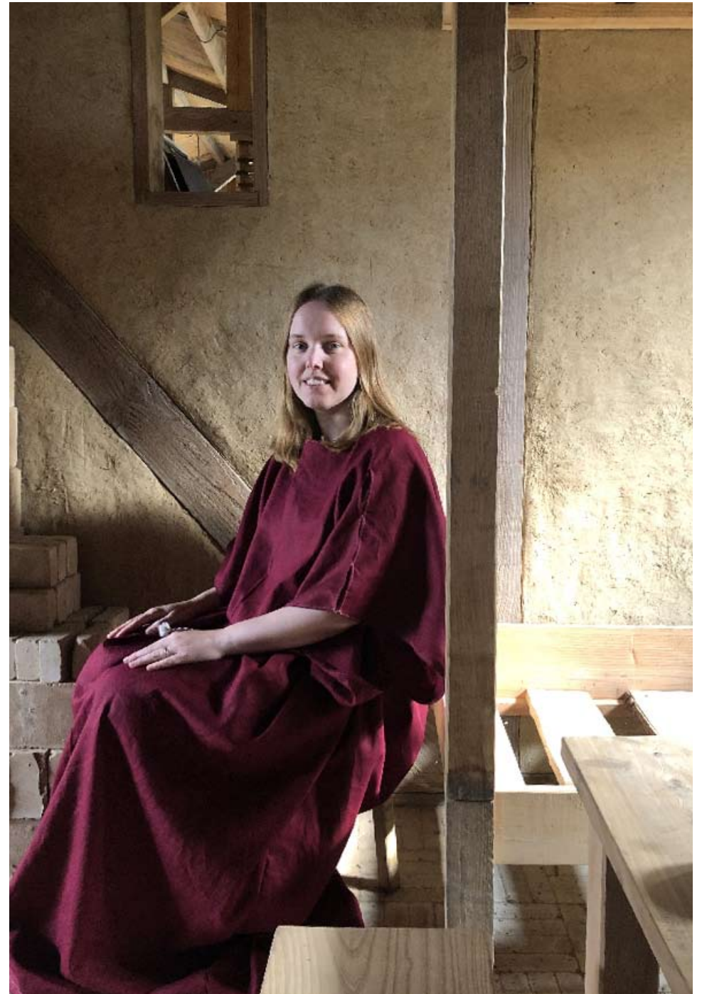
beeldverhaal Romeinse tunica maken workshop