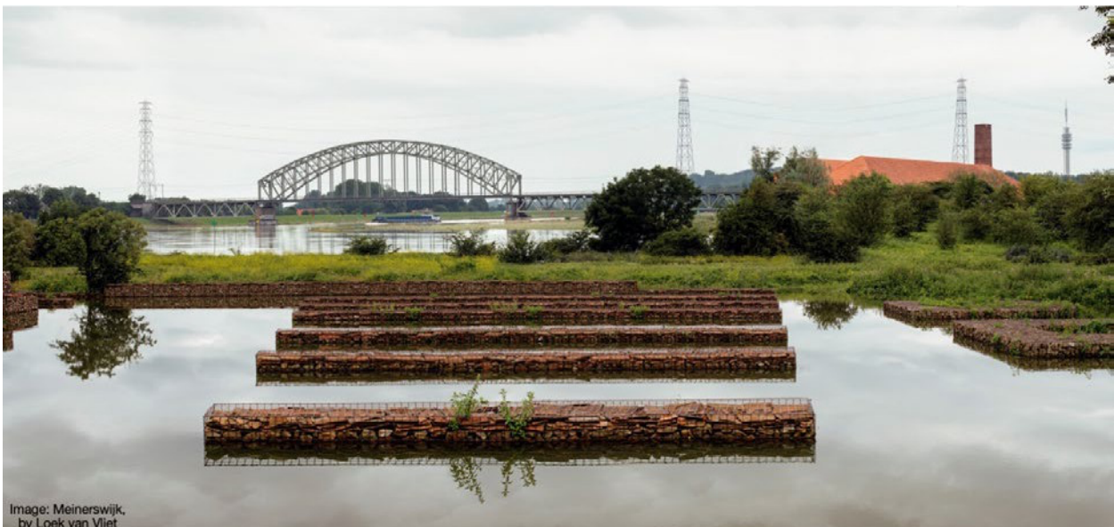
Image: Meinerswijk

De Neder-Germaanse Limes ervaren, raken en begrijpen. Visie op de belevingswaarde 2024-2028 is gemaakt door het Kwaliteitsteam Neder-Germaanse Limes.