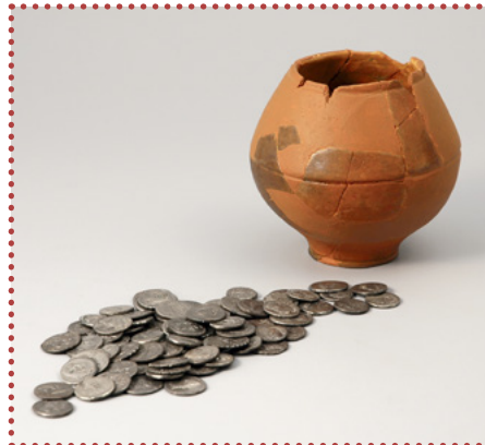
Met de Romeinen kwam ook het betalen met geld naar Nederland. Voor die tijd ruilden mensen eten, spullen en dieren met elkaar.