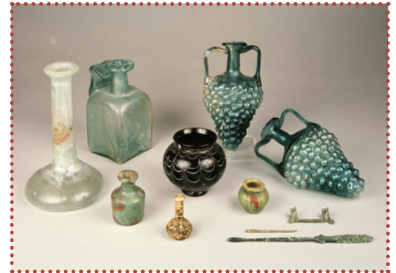
Glasblazen konden de Romeinen al als de beste.

De Romeinen noemden de bewoners ten noorden van de Romeinse rijn 'Germanen' en ten zuiden van de Rijn 'Kelten'. Dat verschil vonden de Romeinen wel zo makkelijk. Maar de volkeren die in die tijd hier woonden, hadden een beetje van allebei. Dus het onderscheid dat de Romeinen maakten, klopt niet helemaal.