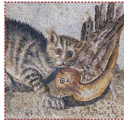
De Romeinen brachten ook dieren mee, zoals katten en kippen.