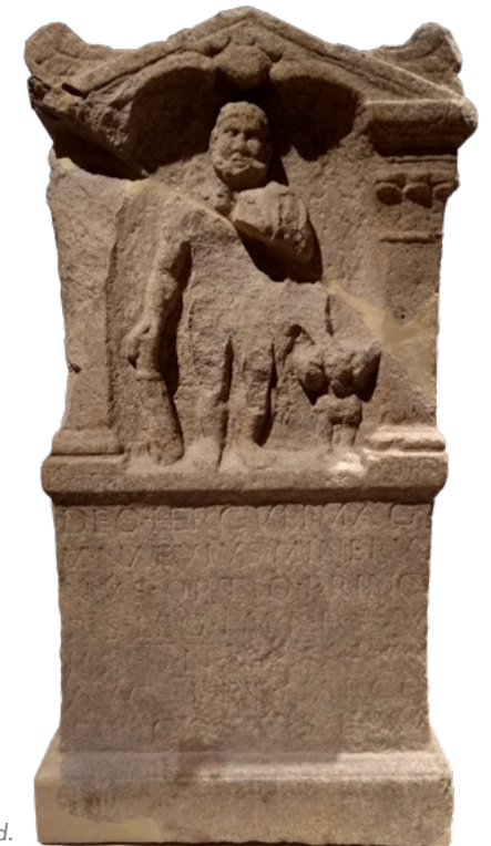
Altaar gewijd aan Hercules Magusanus. Zo'n altaar bestaat uit een uitgebeitelde tekst en soms ook uitgebeitelde afbeelding van de god.

De Romeinen kenden veel verschillende goden. Ze waren heel tolerant tegenover andere godsdiensten. Zolang je ook maar de keizer vereerde, want dat was voor hen ook een soort god. Soms werden Romeinse goden en lokale goden aan elkaar gekoppeld, zoals de Romeinse god Hercules en de Keltische god Magusanus. De Romeinen bouwden daar ook tempels voor, zoals in Elst.