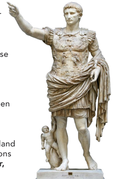
Standbeeld van keizer Augustus.

Van een aantal keizers weten we dat ze in Nederland zijn geweest en dat ze invloed hebben gehad in ons land. Met die keizers ga je in de opdracht 'Keizer, mag ik u wat vragen?' nader kennismaken.