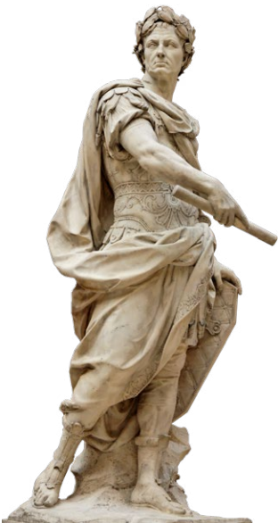
Standbeeld van Julius Caesar.

Het Romeinse Rijk was een van de grootste rijken in de Oudheid. Dat Romeinse Rijk was zo groot dat het nu in 45 landen en op drie verschillende continenten zou liggen: Europa, Azië en Afrika. Ook een groot deel van Nederland was onderdeel van het Romeinse Rijk. De noordgrens van het Romeinse Rijk (de Limes) liep dwars door ons land van Nijmegen tot Katwijk aan zee. Lange tijd was rivier de Rijn de grens in ons land.