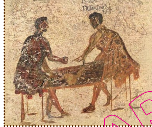
Micare digitis wordt in Italië nog steeds gespeeld, alleen noemen ze het nu Morra .

Hou je eigen punten bij door je vingers van je linkerhand op te steken. Wie het eerst zijn hele linkerhand, dus 5 vingers heeft opgestoken, wint het spel.