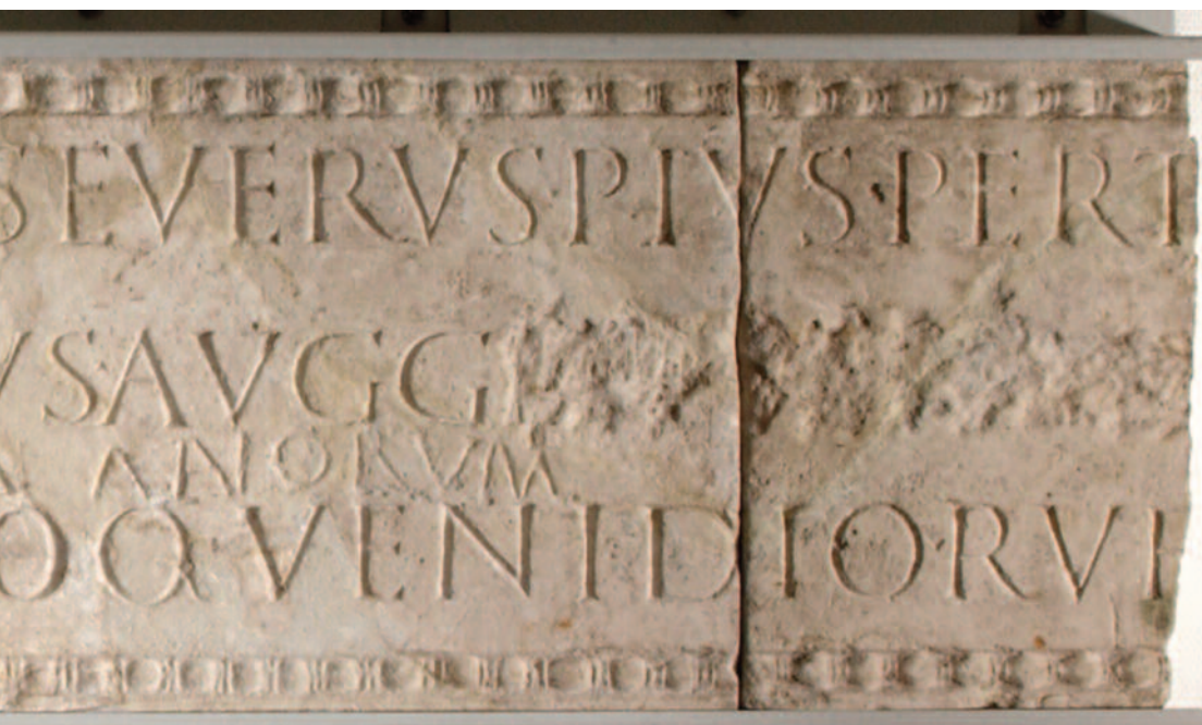
Nieuwbouw in de grensforten bood weer een gelegenheid aan het leger om de macht van Rome ten toon te spreiden. Bij de ingebruikname van het gebouw werd een inscriptie onthuld met de namen van het desbetreffende legeronderdeel en de heersende gouverneur of keizer. Deze bouwinscriptie uit 211 na Christus, ontdekt in Leiden-Roomburg, is door de 'Afdeling Bataafse Verkenner' gewijd aan keizer Septimius Severus en zijn zonen.

Behalve het bouw materiaal zorgden ook de bouwornamentiek, de bouwinscripties en de hoogte van een gebouw voor een monumentale uitstraling. Zo was het hoofdkwartier ( principia ) van de legerplaats van het Tiende Legioen in Nijmegen niet alleen naar onze maatstaven een monumentaal gebouw, maar ook naar die van toen. Zoals een kathedraal in een middeleeuwse stad rees de principia in de legioensvesting hoog uit boven alle andere gebouwen en zal vanuit het noorden duidelijk zichtbaar zijn geweest als representant van de macht van Rome en de keizer.