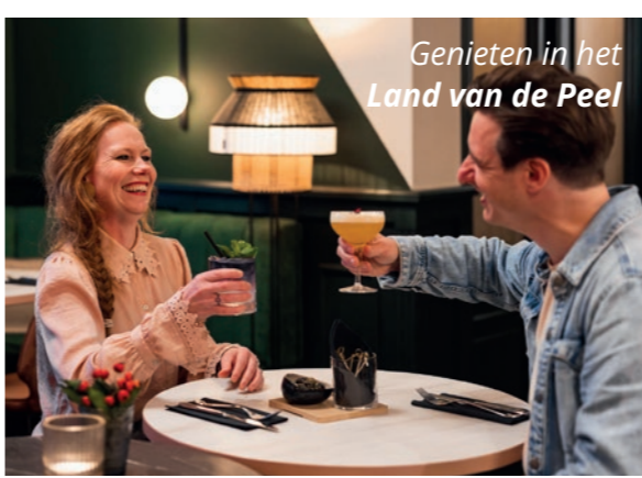
Genieten in het Land van de Peel

In de Peel wordt volop genoten van het leven. Dat proef én beleef je. Verwen jezelf en een ander met een exclusief diner of weekendje weg in de Peel. Proost met een Peelneutje, een lokaal speciaalbiertje en vier het leven in de Peel! Van sappige tomaten en zoete aardbeien tot een vers getapt glas melk.