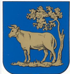
gemeentewapen van Oss (1817)