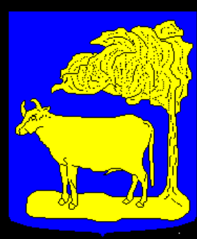
gemeentewapen van Oss (1817)