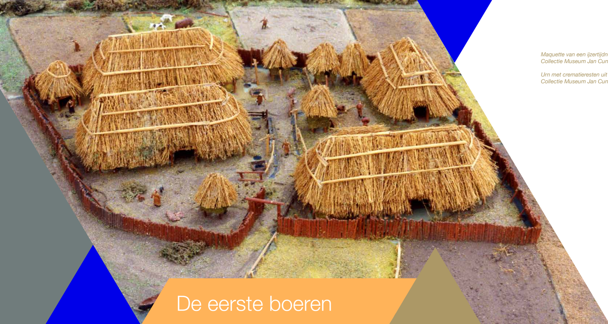
Maquette van een ijzertijdnederzetting. Collectie Museum Jan Cunen.