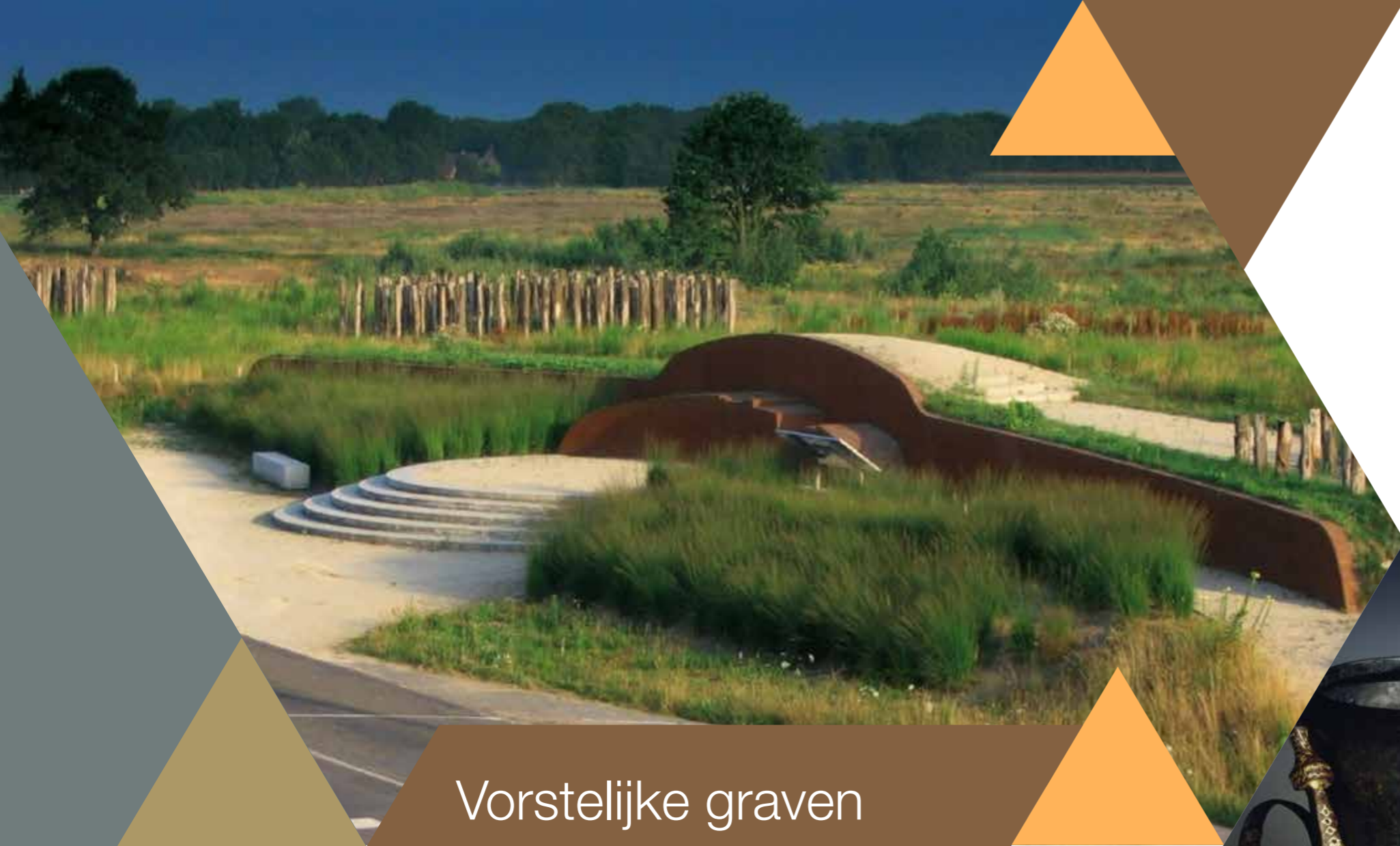
Zicht op het gereconstrueerde Vorstengraf van Oss.