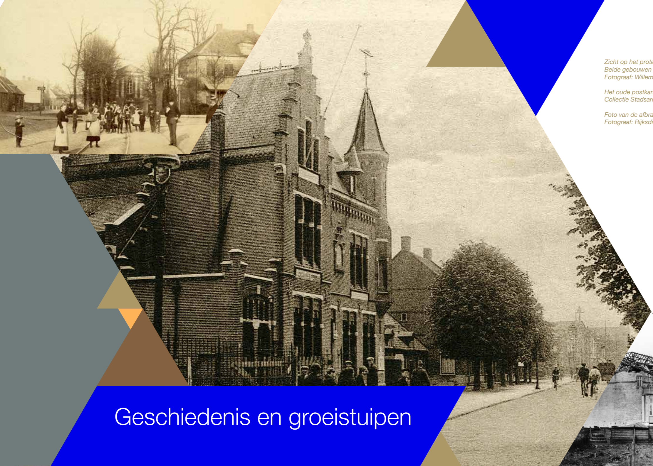
Zicht op het protestantse kerkje en de pastorie aan het Walplein in Oss, 1892. Beide gebouwen hebben in de jaren zestig plaatsgemaakt voor het pand van de V&D.