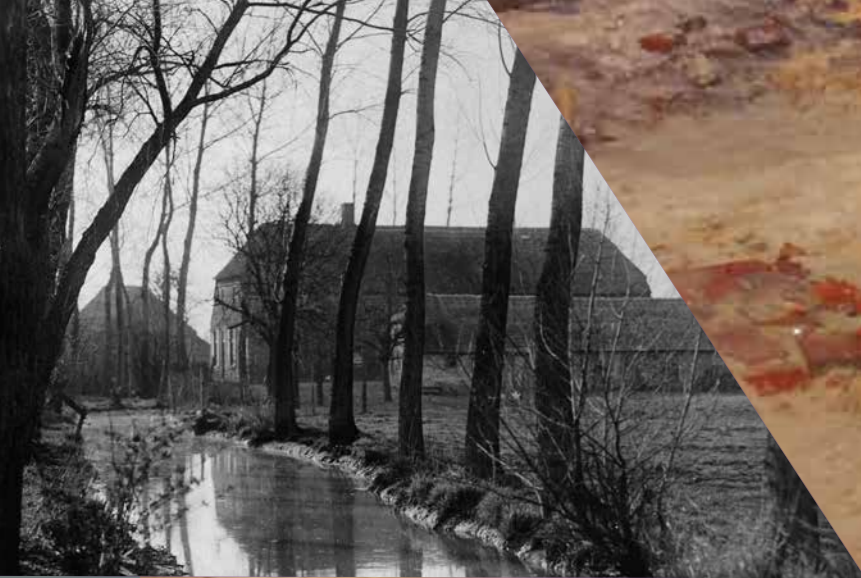
De restanten van de Osse stadsgracht rond 1900.