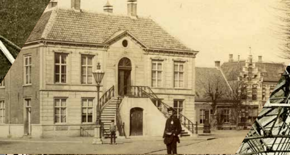
De boterwaag op de Heuvel in 1892, het symbool van de groei van Oss. Het waagegebouw was tevens raadhuis en had een kleine politiecel.