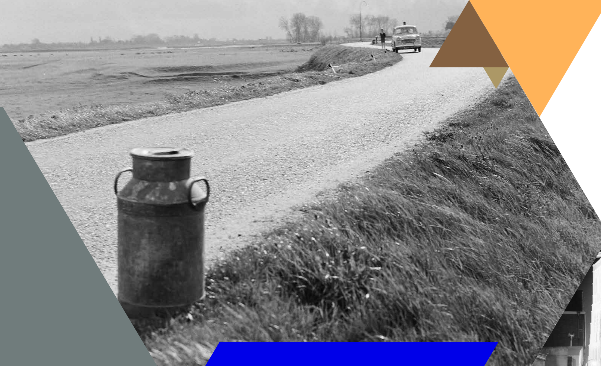
Het vruchtbare Maasland, 1960.