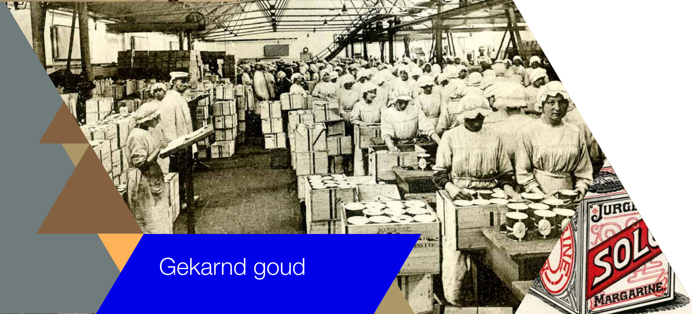
Solo Margarine, een van de bekende merken van Jurgens.

De relatieve rust na de Tachtigjarige Oorlog kwam de landbouw en handel ten goede. De Osse Heuvel was en bleef het centrale plein van het Maasland, met zijn uitgestrekte vruchtbare weidegrond. De koeien die in die weilanden stonden, gaven nog steeds veel melk. Daaruit werd veel boter gemaakt. En die boter trok de handel naar Oss. In de regio werd bij gebrek aan echt geld soms zelfs betaald met het 'smeerbare goud'. Toen Oss in de achttiende eeuw een officiële boterwaag mocht opzetten, werd de rol van handelscentrum verder bevestigd. De Osse boter werd door slimme handelaren zelfs internationaal vermarkt. Met het uitbreken van de industriële revolutie groeide de bevolking in de grote steden exponentieel, vooral in Engeland. Overal ging Osse boter de kelen in. Tot het punt dat aan de vraag naar natuurboter niet meer te voldoen was. Net op dat moment kwam de uitvinding van de zogenaamde 'kunstboter', die we nu kennen als 'margarine'.