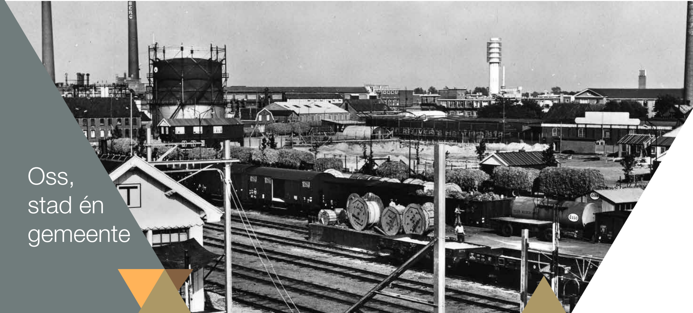
Oss, fabrieksstad. Een ansichtkaart uit 1961.