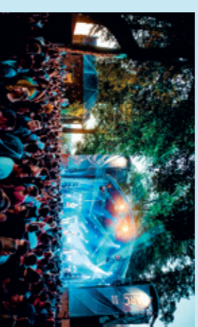
Festival met links de Sint-Nicolaaskapel

Ook voor festivals ben je op je plek in het Valkhofkwartier. Je vindt hier muzikale evenementen, culinaire festivals, de Nijmeegse Bierfeesten en niet te vergeten optredens tijdens de Vierdaagsefeesten.