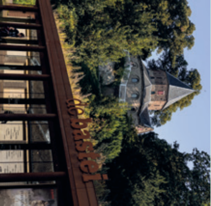
De Sint-Nicolaaskapel en De Bastei

ONTDEK HET OUDSTE STADSPARK VAN NEDERLAND