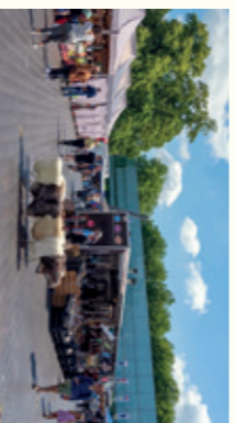
Markt op het Kelfkensbos met op de achtergrond het Valkhof Museum

De markt in het Valkhofkwartier is een begrip in Nijmegen. Op het Kelfkensbos vindt op maandag een grote groente- markt plaats en op zaterdag kun je hier terecht voor verse en biologische producten.