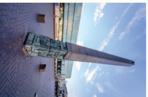
De godenpijler voor het Valkhof Museum