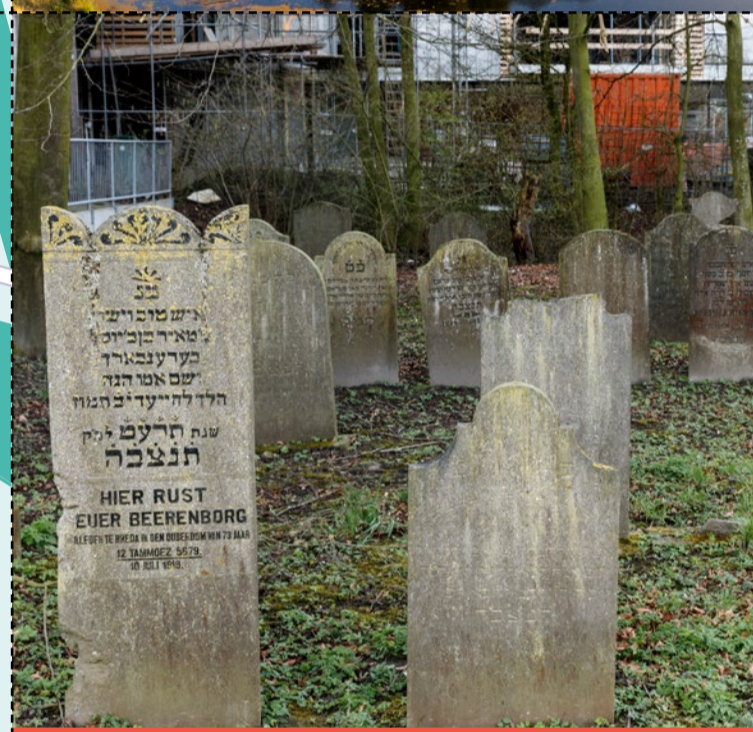
33 Joodse Begraafplaats Klundert kende - met name in de 19e eeuw - een kleine Joodse gemeenschap. De begraafplaats met 66 graven herinnert daaraan. Blauwe Hoefsweg 22, Klundert