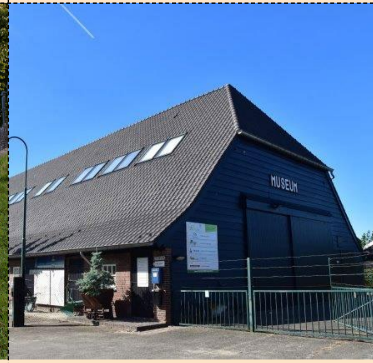
11 Nationaal Vlasserij-Suikermuseum Museum waarin het werken met vlas en suikerbieten en het leven in de suikerfabriek centraal staat. Gevestigd in een gerestaureerde domeinboerderij. Stoofdijk 1a, Klundert