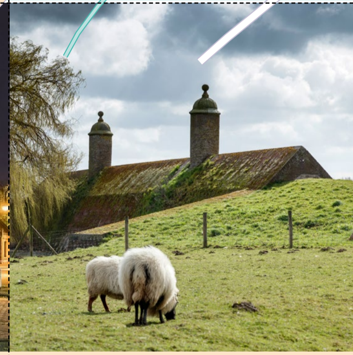
14 Stenen Poppen Dit bouwwerk van baksteen moest het eventuele vijanden bemoeilijken om via de gracht de stad binnen te vallen.