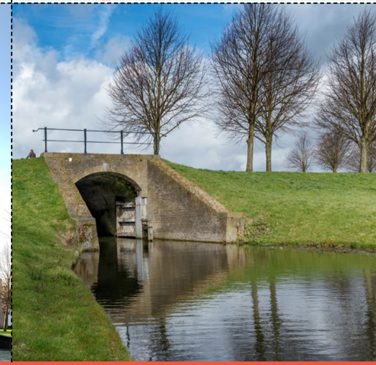
31 Verlaatsheul Voor de uitwatering van de Bottekreek werd eind 16e eeuw een sluis (verlaat) aangelegd. In de boog is nog een sluitsteen te zien van een restauratie uit 1769. Verlaatsstraat 26, Klundert