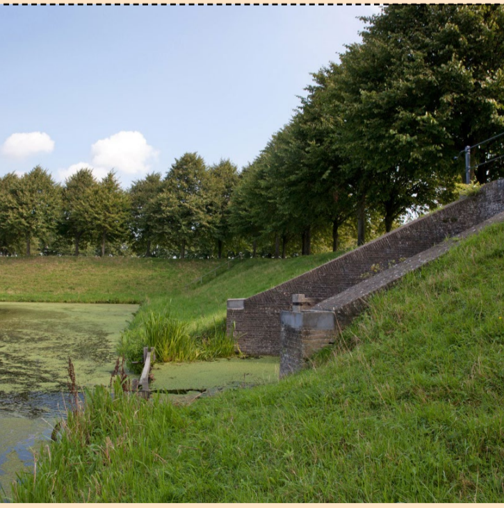
2 Vestingstad Klundert Bastions, ravelijnen, poorten, grachten en wallen moesten ten tijde van de 80-jarige oorlog de Spanjaarden tegenhouden. De restanten hebben nu de status van rijksmonument.