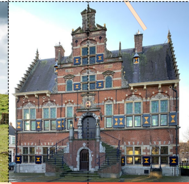
30 Oude Stadhuis Rijkelijk met ornamenten van natuursteen versierd gebouw van rode en gele baksteen. Rijksmonument, ontworpen door Melchior van Herboach. Stadhuisring 1, Klundert