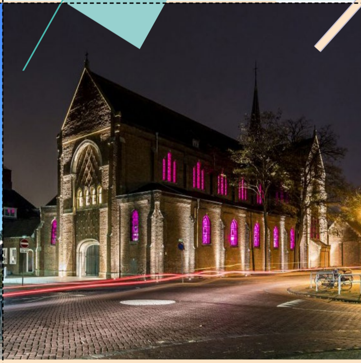
13 De Stad Klundert Voormalige Johannes de Doperkerk uit eind 19e eeuw, midden in het historische centrum van Klundert. Gemeentelijk monument, en een typisch voorbeeld van een zogenaamde driebeukige kruiskerk. Molenstraat 33, Klundert