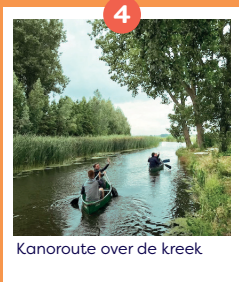
Kanonroute over de kreek