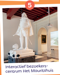
Interactief bezoekerscentrum Het Mauritshuis