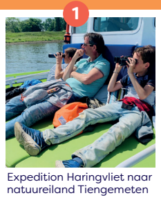
Expedition Haringvliet naar natuureiland Tiengemeten