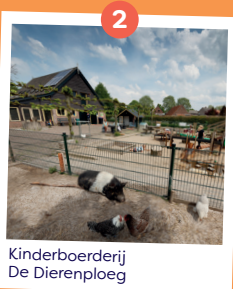
Kinderboerderij De Dierenploeg