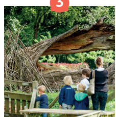
Het Patersbos en Kapucijnenklooster