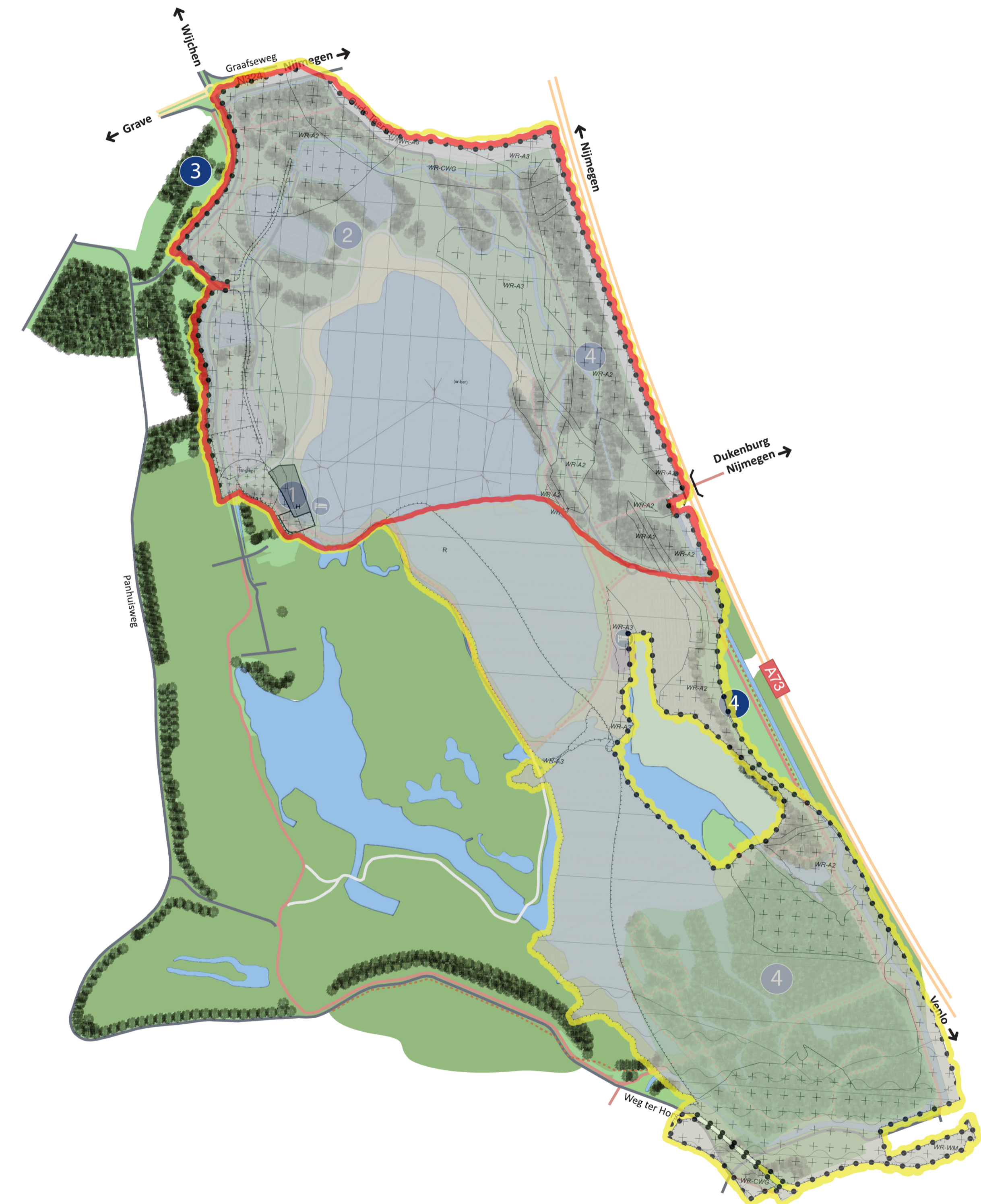
Evenementenzones op te nemen in bestemmingsplan