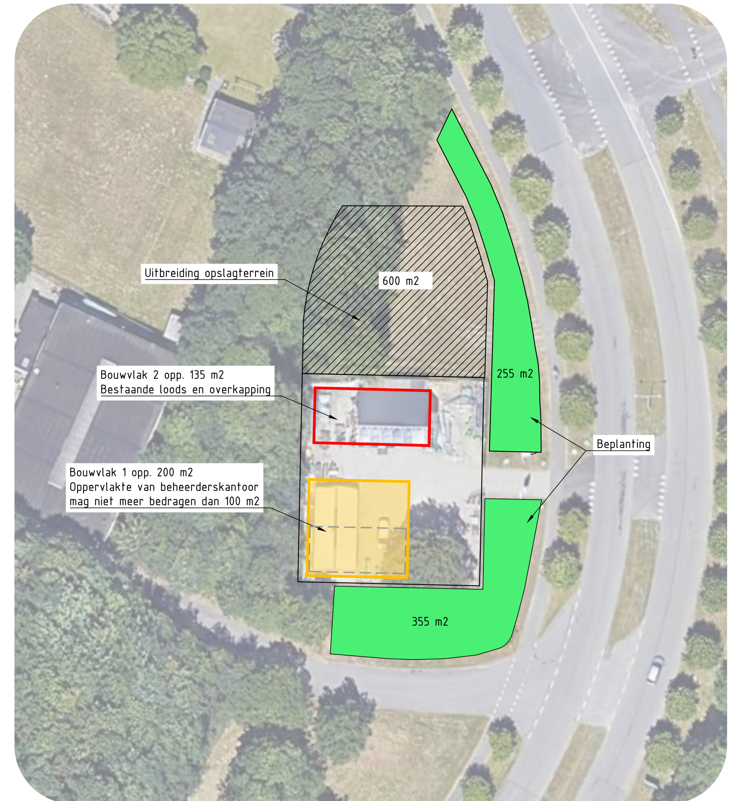
Programma op te nemen in bestemmingsplan