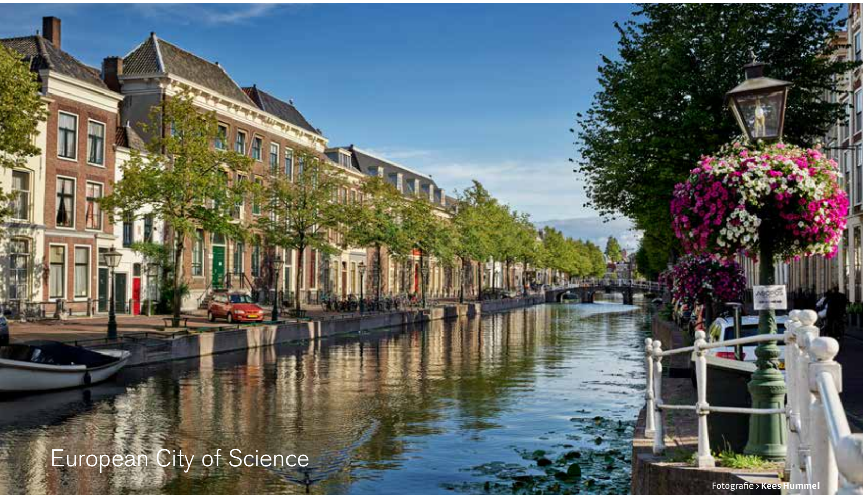
European City of Science