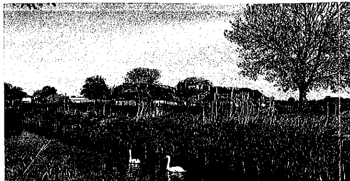
Het Oude Maasje