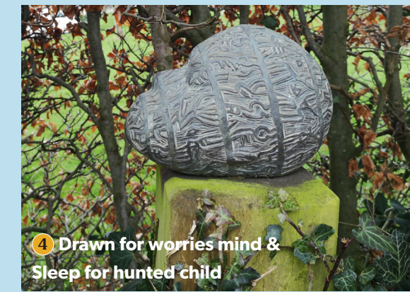
4 Drawn for worries mind & Sleep for hunted child

Het verzetmonument in Middenbeemster is opgericht ter nagedachtenis aan elf plaatselijke verzetsmensen die tijdens de Tweede Wereldoorlog, in de strijd om vrede en vrijheid, om het leven zijn gekomen.