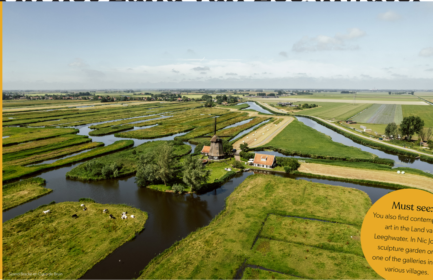
Spierd Bracke en Cuno de Bruijn

The Land van Leeghwater is a landscape of peat meadows, reclamations and picturesque villages. A wonderful natural area, made largely by human hands. The area has a rich, vibrant history of herring fishing, whaling, trade and industry. Venture into the area and discover the stories of the heroes of De Rijk, lively villages and countryside that stretches as far as the eye can see.