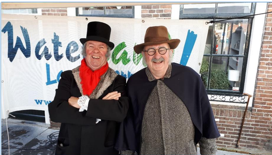
Het bestuur in stijl op de Wintermarkt bij de promotie van Waterland en het werven van 'Vrienden van Waterland'

Daarbij zij aangetekend dat het Informatiepunt Marken ook over 2018 voor SPW een nadelig saldo oplevert. SPW kiest er ook dit jaar voor om geen gebruik te maken van de garantstelling van de gemeente, maar het tekort uit eigen reserves te dekken.