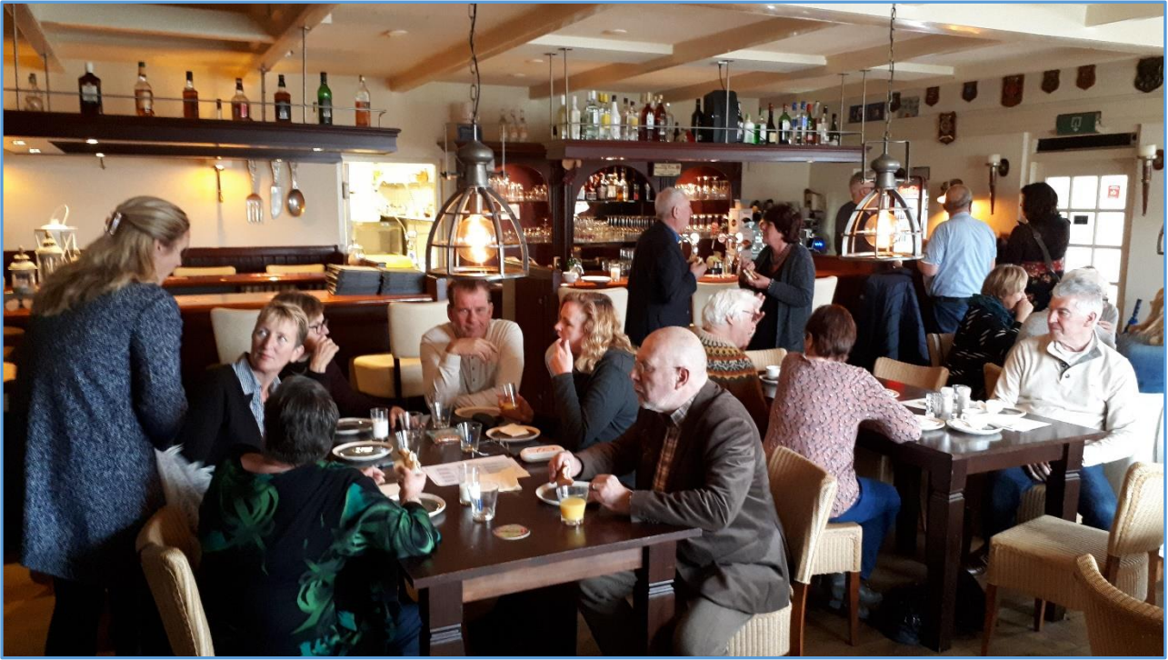
Gezellig napraten na een intensieve, constructieve en productieve vrijwilligersdag