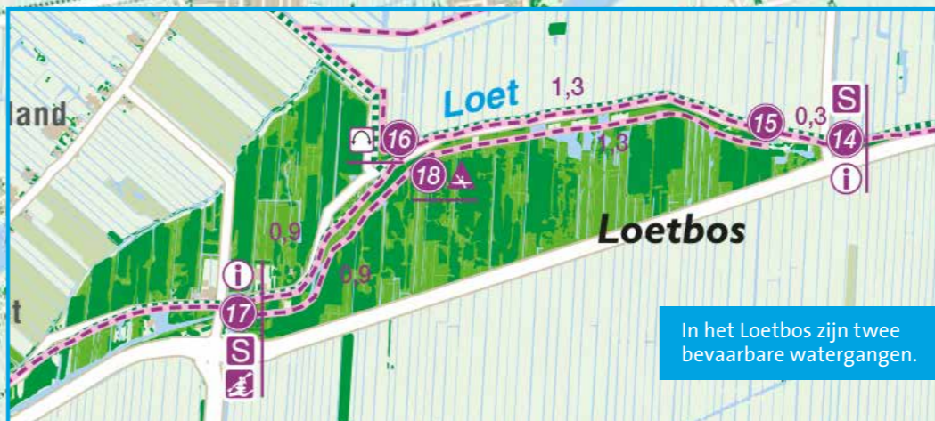
In het Loetbos zijn twee bevaarbare watergangen.

Sportief plezier voor iedereen met het kanoroutenetwerk Krimpenerwaard