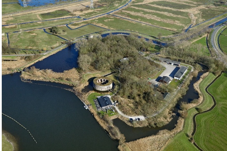
Afb. 1 Fort Uitermeer ligt langs de Vecht vlakbij Weesp. Het is een prachtige plek voor fietsers, wandelaars en watersporters, met een restaurant en een aanlegsteiger voor sloepen en kano's. Het fortterrein is vrij toegankelijk.