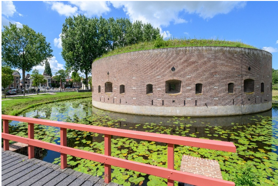
Afb. 5 Fort aan de Ossenmarkt in Weesp, voltooid in 1861. De vesting Weesp behoorde vanaf 1854 tot de Nieuwe Hollandse Waterlinie en werd in 1892 bij de Stelling van Amsterdam gevoegd. Het fort had als taak om de Vecht en de spoorweg Amsterdam-Amersfoort te verdedigen.