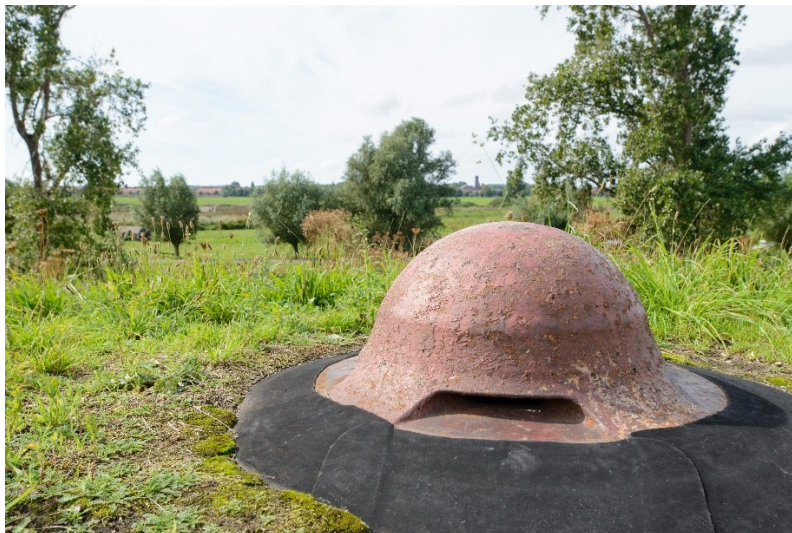
Afb. 5 Observatiekoepel op Fort bezuiden Spaarndam. Het fort beschermde de accessen Slaperdijk en het Noorder-Spaarne. De aanleg van het fort begon in 1885 en werd pas in 1901 voltooid. Fort bezuiden Spaarndam was net als Fort benoorden Spaarndam een van de eerste forten gebouwd van ongewapend betoncement. Tijdens de mobilisatie in de Eerste Wereldoorlog waren er 177 militairen gelegerd. Daarvan getuigen nog verschillende muurschilderingen op de formuren, gemaakt door de soldaten als tijdverdrijf tegen de verveling.