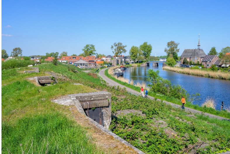
Afb. 1 Het Boezemkanaal bij Fort bezuiden Spaarndam, met de Liniewal en op de achtergrond de Visserseindebrug. Het fort herbergt tegenwoordig horecalocatie Fort Zuid.