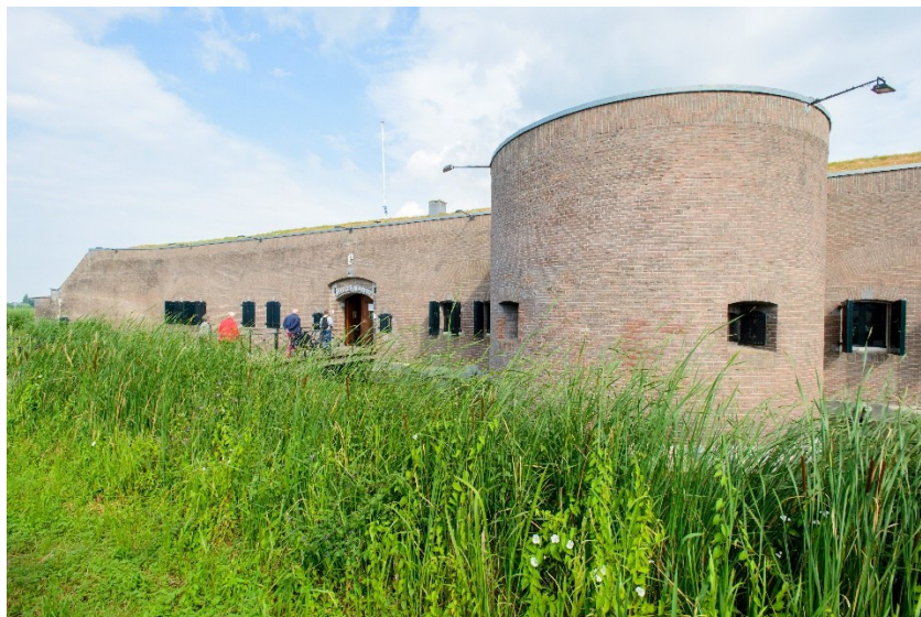
Afb. 5 Fort C in Muiden, ook wel bekend als het Muizenfort. Gebouwd van 1874-1877 als versterking van de Nieuwe Hollandse Waterlinie fungeerde het als schakel met de Stelling van Amsterdam. Het loopgravencircuit bij de frontwallen verbindt het fort met een originele Nederlandse (Piramide-) groepsschuilplaats uit de mobilisatieperiode 1939-1940, een waarnemingspost en een voormalige mitrailleurkazemat.