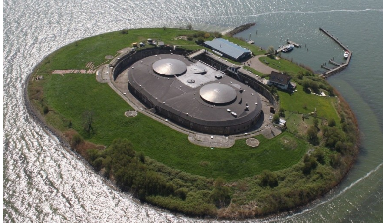
Afb. 1 Forteiland Pampus is aangelegd tussen 1887 en 1895 als onderdeel van de Stelling van Amsterdam. Pampus verdedigde de hoofdstad tegen aanvallen vanuit de voormalig Zuiderzee, samen met de Kustbatterijen bij Diemerdam en Durgerdam. Tegenwoordig is Pampus het meest bezochte fort van de Stelling van Amsterdam.