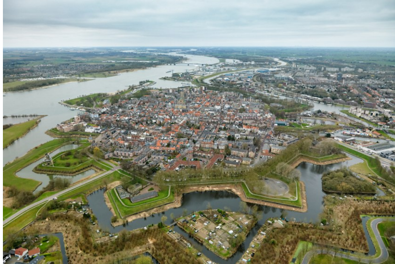
Afb. 1 Vesting Gorinchem in westelijke richting, met linksboven de Waal.