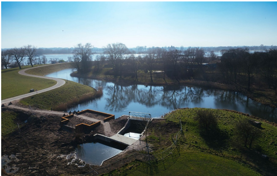
Afb. 5 Het linielandschap langs de Waaldijk. Een financiële bijdrage vanuit de Erfgoed Deal maakte het mogelijk om bij de dijkversterking langs de Waal het verhaal van de Hollandse Waterlinies te versterken.