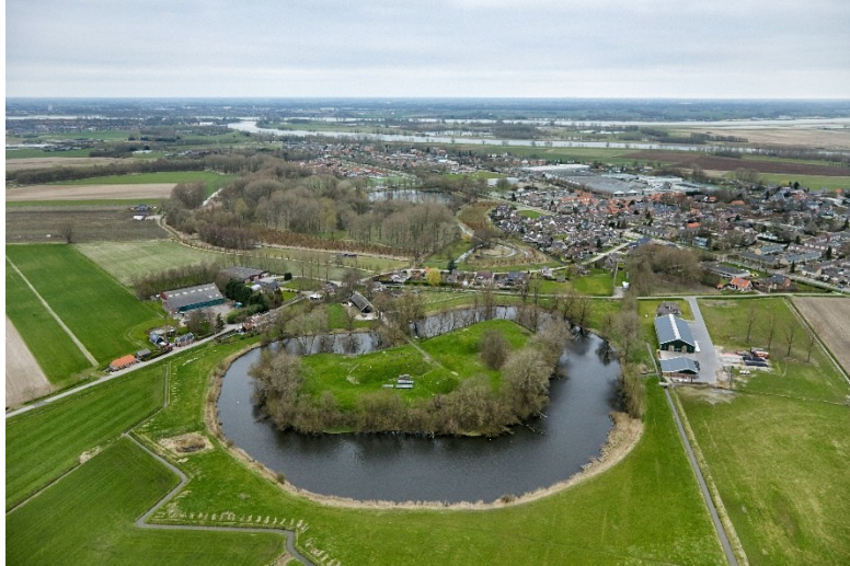
Afb. 1 Fort bij Giessen, eigendom van Brabants Landschap, nu in gebruik als natuur- en educatiefort.