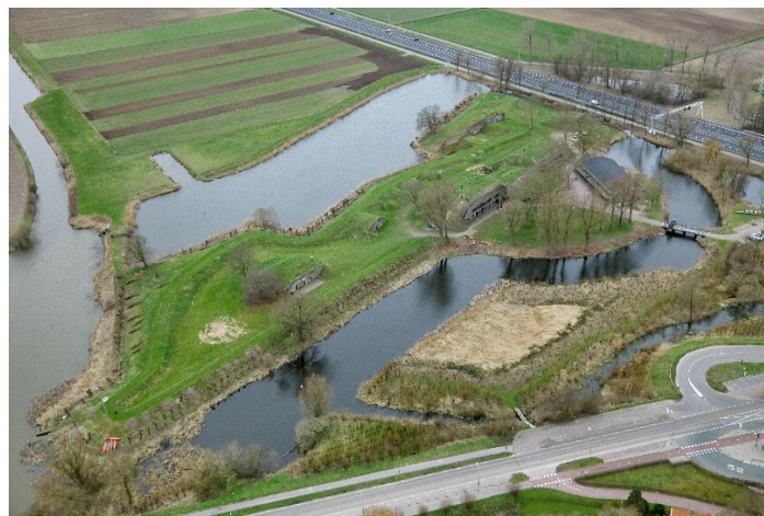
Afb. 5 Fort Altena vanuit het noordoosten. De A27 doorsnijdt het westelijk deel van het fort.