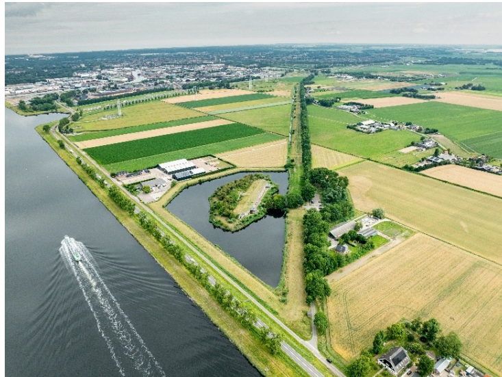
Afb. 1 Fort Zuidwijkermeer in Assendelft, nu in gebruik als kaasfort.