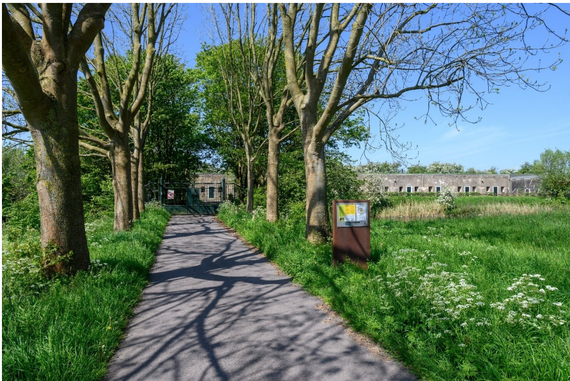
Afb. 5 Fort Zuidwijkermeer vanaf de Kanaalweg.