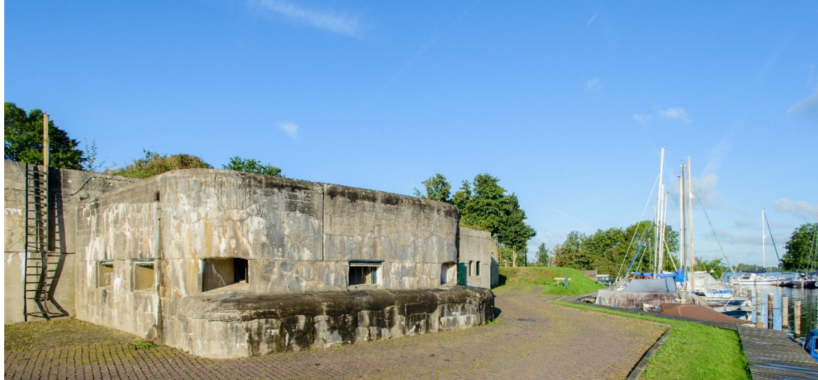
Afb. 1 Fort Kudelstaart – ook wel bekend als Zeilfort Kudelstaart - is eigendom van de gemeente Aalsmeer en nu in gebruik als jachthaven.