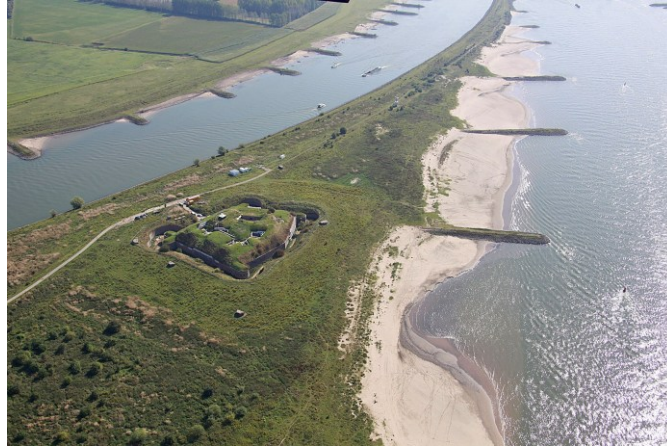
Afb. 1 Fort Pannerden, strategisch gelegen op een landtong tussen de Waal (rechts) en het Pannerdensch kanaal (links). Het fort is nu een museum.