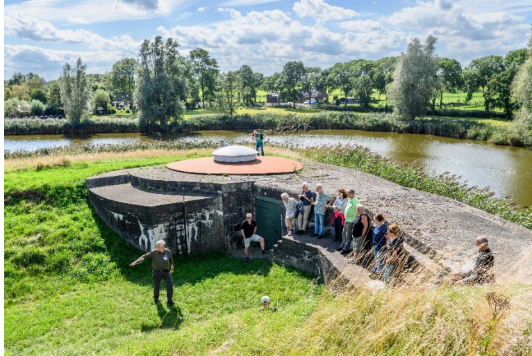
Afb. 1 Fort Waver-Amstel in buurgemeente De Ronde Venen, aan de overkant van de Waver. De verboden kringen liggen deels in Ouder-Amstel.