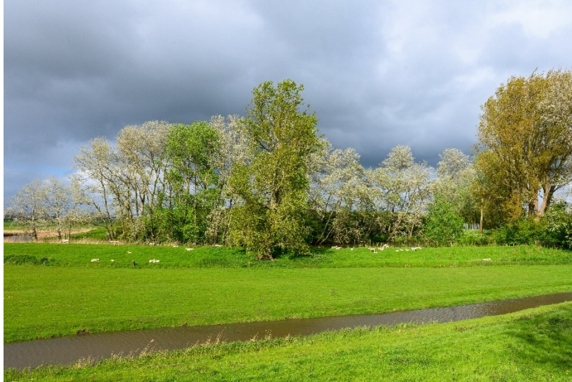
Afb. 1 Fort aan den Ham in Uitgeest, nu in gebruik als militair museum.