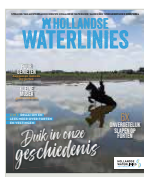
COVER: Maker foto Desiree Meulemans + makers kunstwerk: kunstwerk 'Het Geheim van Man en Paard' van kunstenaarsduo Willy Kruijssen en Christel van Vliet

Het landschap van Unesco Werelderfgoed Hollandse Waterlinies zit vol bijzondere verhalen die je pas kunt lezen als je ze herkent. In het open, lege landschap liggen onzichtbare verboden kringen en de hoofdverdedigingslijn. Deze lijn geeft de grens aan tussen de veilige en onveilige zijde. Als je goed kijkt, zie je op verschillende plaatsen sluisen, dijken en gemalen. Die werden gebruikt om een brede strook land tot kniediep onder water te zetten, waardoor een onneembare barrière voor de vijand ontstond. Zo werd water een onze bondgenoot. Dit landschap is het best te beleven op de fiets of te voet langs een van de vele fiets en wandelroutes. Ga er op uit en ontdek de verhalen van de Hollandse Waterlinies.