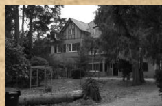
Dubbele Villa, Landgoed Oude Tempel Oude Tempellaan 16-18