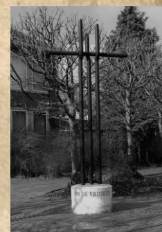
Oorlogsmonument ter herinnering aan WO II, Kampweg