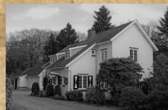
Voormalig Jachthuis, Landgoed Oude Tempel, Oude Tempellaan 3

De gemeente Soest (Soest en Soesterberg) heeft 89 aangewezen gemeentelijke monumenten en 42 aangewezen rijksmonumenten. Tijdens uw audiotour door Soest komt u een aantal van deze monumenten tegen. Wilt u meer weten over deze monumenten dan kunt u de details van deze monumenten vinden op www.soest.nl , www.museumsoest.nl en www.hvsoest.nl .