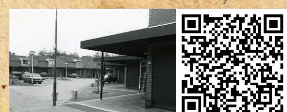
8 AMERIKAANSE WIJKEN