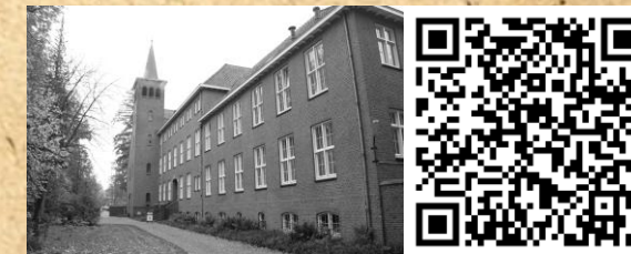
1 KONTAKT DER KONTINENTEN