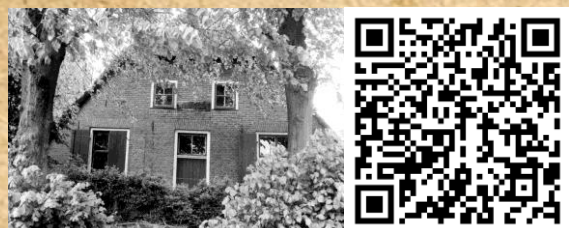
5. BOERDERIJ 'OUDERS VRUCHT'