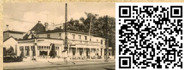
3 'T ZWAANTJE' EN MARECHAUSSEE