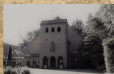
Heilige Carolus Borromeüskerk, Rademakerstraat 159