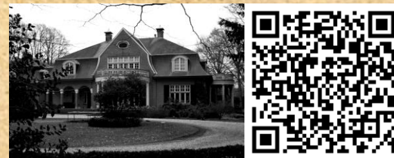
2 VILLA EGGHEMONDE