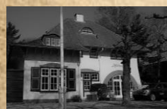
Landhuis 'Heidewijk', Banningstraat 3