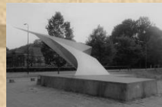
Vliegermonument 'De Vleugel', hoek Kampweg & Banningstraat