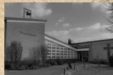
Vredekerk, Prot. Gemeente Soesterberg, Generaal Winkelmanstraat 10