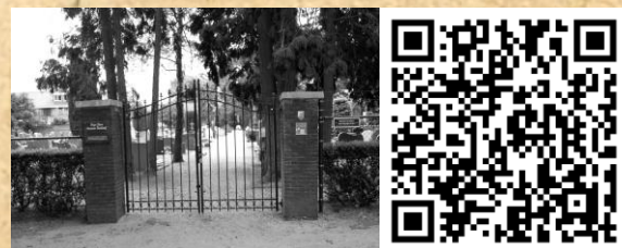
6 KERKHOF CAROLUS BORROMEUSKERK