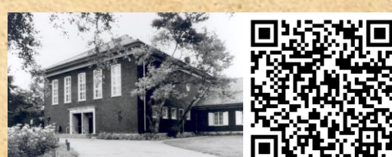
7 VOORMALIG OFFICIERSCASINO