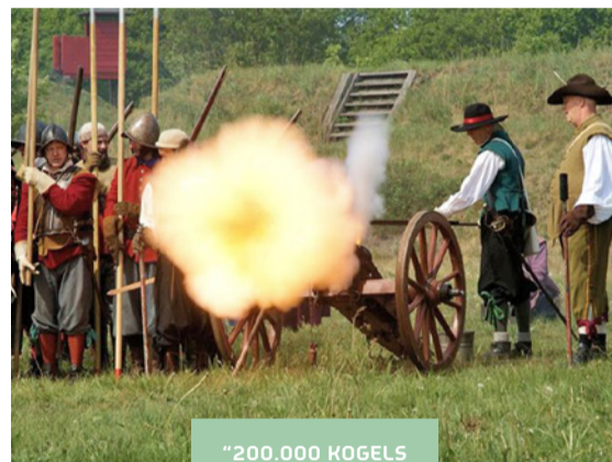
"200.000 HOGELS KAN HIJ KRIJGEN!"

De poorten van Vesting Bourtange zijn dagelijks geopend. De vorm is bijzonder: vijf bastions zijn geheel omringd door water met hoge vestingwallen. Hierdoor kon men de vijand al van verre zien aankomen en het maakte ze moeilijk om binnen te komen. Via een van de drie imposante bruggen loop je naar binnen waar je meer te weten komt over de geschiedenis in de vijf aanwezige musea. Er zijn leuke winkeltjes en terrassen en als je geluk hebt, wordt er geschoten met de oude kanonnen.