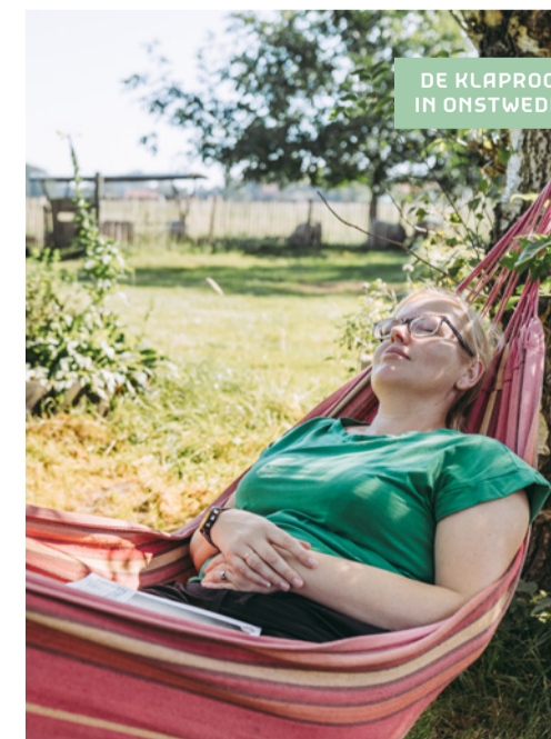
DE KLAPROOS IN ONSTWEDDE

Stille, onthaasten en bezinning: deze woorden zijn onlosmakelijk verbonden met Westerwolde. Een regio waar je geniet van verrassende landschappen, oude bossen, prachtige beekdalen, schitterende natuurgebieden en knusse dorpen. Geen stadsgeluiden maar fluitende vogels, het geruis van de wind en je eigen gedachten. Zoek je verstillend, inspiratie én gastvrijheid? Dat vind je in Westerwolde.