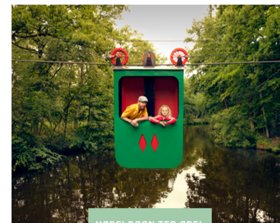
KABELBAAN TER APEL

Dwars door Westerwolde kronkelt De Ruiten Aa, ook wel de 'ruggengraat van Westerwolde' genoemd. De Ruiten Aa is in de jaren zestig rechtgetrokken en in de jaren negentig hersteld. Langzaam kreeg ze haar oorspronkelijke bedding terug. Het resultaat van de herstelwerkzaamheden is een bijzonder gebied met prachtige natuur. Dat het in zo'n korte tijd zoveel verschillende habitats vertoont, is uniek in Nederland. Het dal staat bekend als een van de mooiste beekdalen van Nederland.