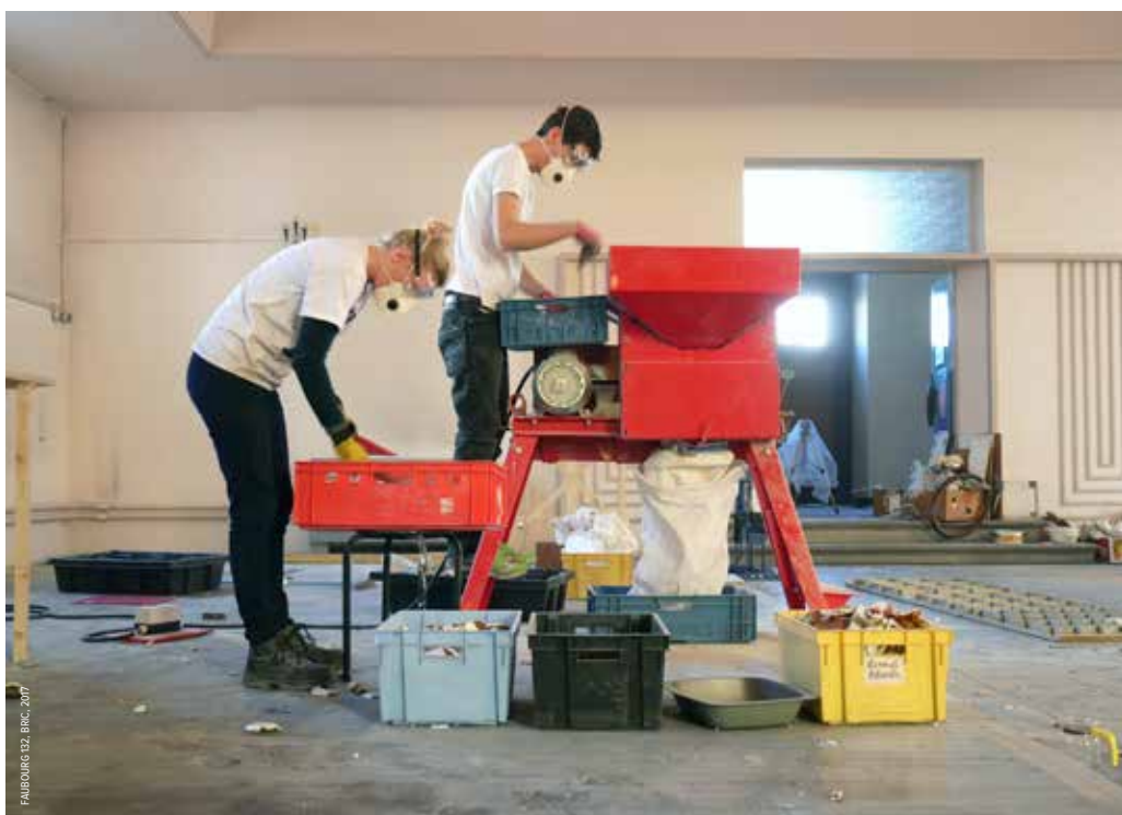
In 2020 slaat designhoofdstad Rijsel aan het experimenteren. De nieuwe uitvindingen kan iedereen gaan bewonderen.