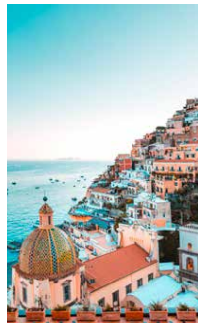
Ook de Italiaanse Amalfikust is werelderfgoed.

1 .121 monumenten, 167 landen: zoveel plekken van universele waarde heeft Unesco sinds 1972 op haar lijst gezet. Het zijn meesterwerken van menselijke creativiteit die getuigen over historische gebeurtenissen en belangrijke ontwikkelingen, maar ook gebieden met een uitzonderlijke natuurlijke schoonheid. Plaatsen uit het verleden die ons lessen laten trekken voor de toekomst. De Atlas van het Werelderfgoed is een wereldatlas waarin het erfgoed een plaats op de kaarten heeft gekregen. Daarnaast wordt elke Unesco-plek ook nog eens beschreven en getoond. Vijf kilo boek maar een ton aan verwondering.