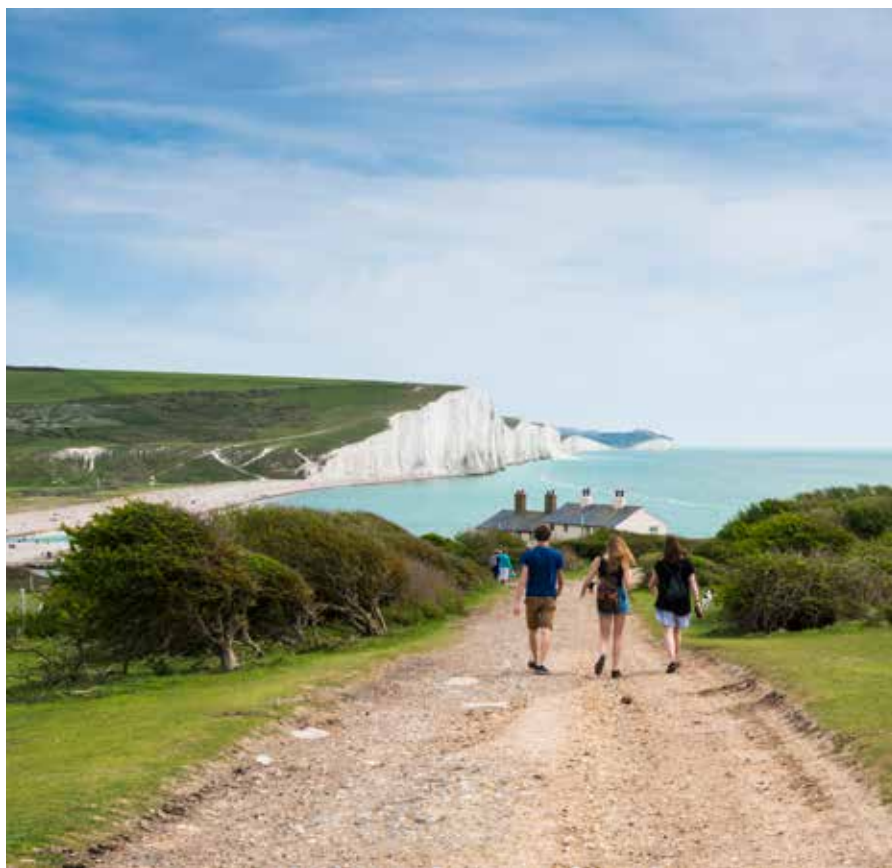
Het South Downs National Park viert zijn tiende jubileum.

www.nature2020.org.uk // thelivingcoast.org.uk