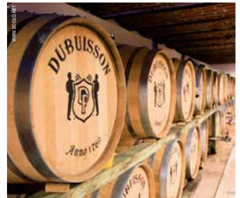
De oudste brouwerij van Wallonië is mee met haar tijd.