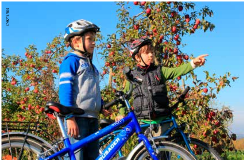
Wie graag fietst tussen en proeft van blozend fruit, moet richting Leipzig.