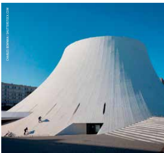
Opvallende architectuur: cultuurhuis Le Volcan in Le Havre.