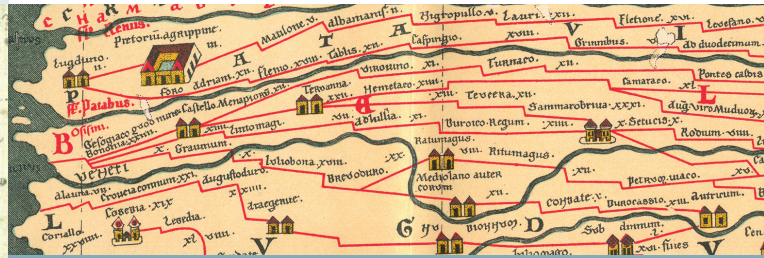
De Peutingerkaart is een oude Romeinse wegenkaart