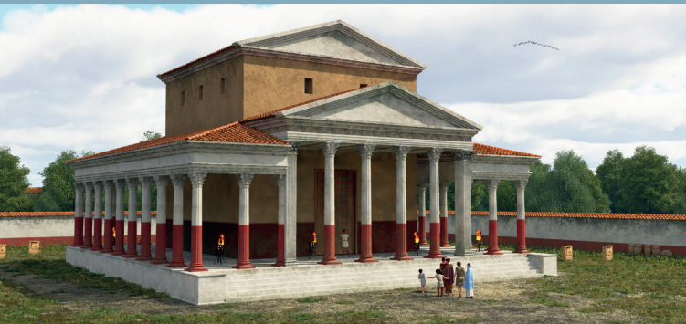
De tempel van Kessel