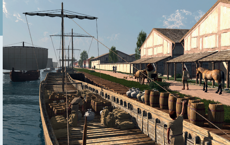
Mogelijk heeft Romeins Rossum eruitgezien als de haven van Forum Hadriani (Voorburg) langs het kanaal van Corbulo

Zoals de Spanjaarden ooit Fort Sint-Andries en andere verdedigingswerken bouwden om zich tegen de Hollanders te kunnen verdedigen, zo legden de Romeinen de Limes aan om zich tegen Germaanse stammen uit het noorden en oosten te kunnen weren.