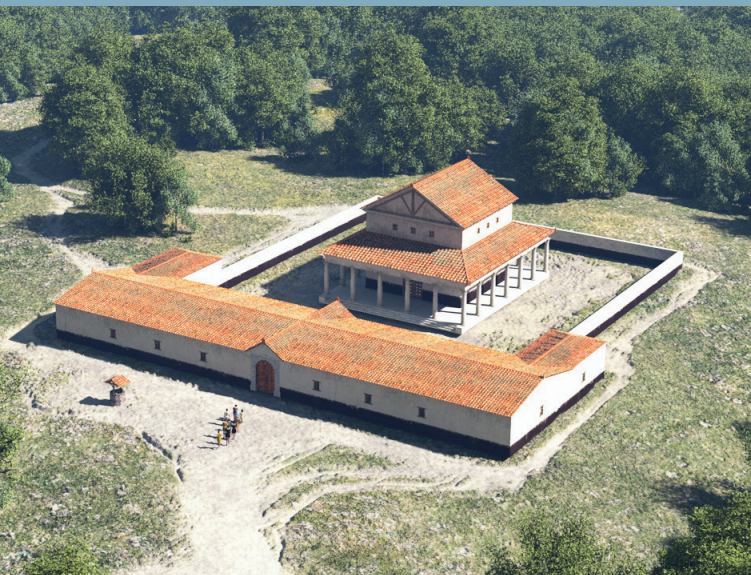
De tempel van Empel