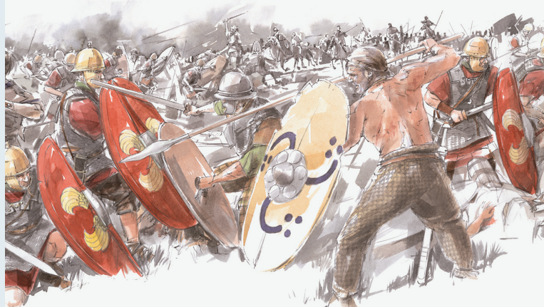
Strijd tussen Romeinen en Germanen

In het jaar 55 voor Christus behaalde de Romeinse krijgshoofd en politicus Julius Caesar op deze plek langs de Maas een verpletterende zege op twee Germaanse stammen: de Tencteren en Usipeten. De enorme hoeveelheid menselijke botten en wapens die hier gevonden zijn herinneren aan die dramatische gebeurtenis.