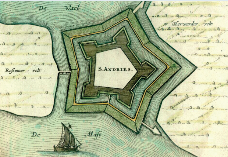
Het oude Fort Sint Andries door Joan Blaeu

In de Romeinse tijd wemelde het in Rossum van de schippers en handelaars. Archeologen vermoeden dat hier een belangrijke havenplaats lag met de naam Grinnes .