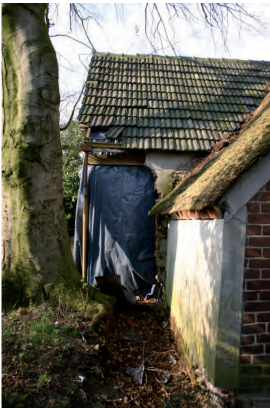
Afbeelding 04: De rechter zijgevel gezien vanaf de achtergevel. De hoek van het pand is gesloopt na beschadigingen veroorzaakt door de boom op de voorgrond.