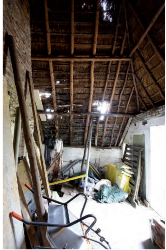
Afbeelding 13: Het voormalige staldeel. Links op de foto de achterzijde van de schouw.