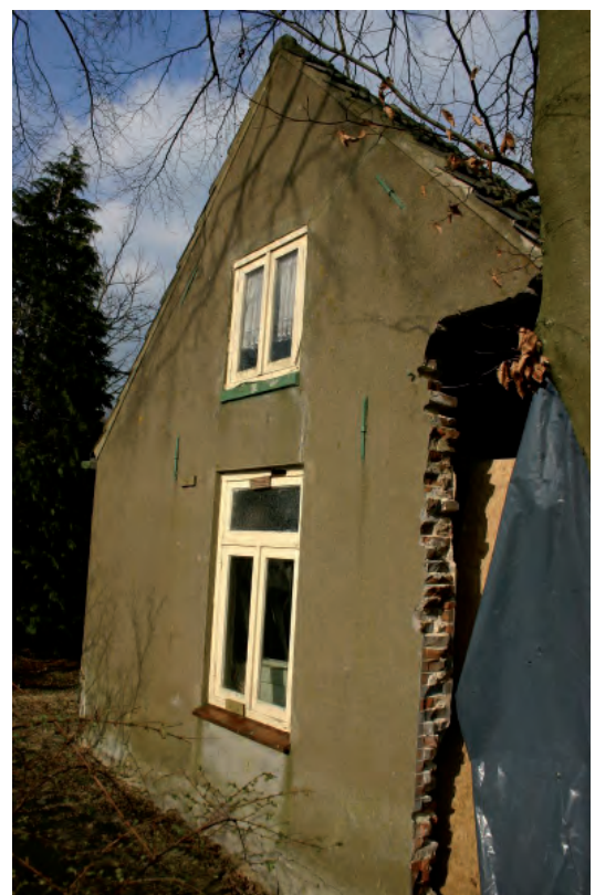
Afbeelding 05: De topgevel van de boerderij.