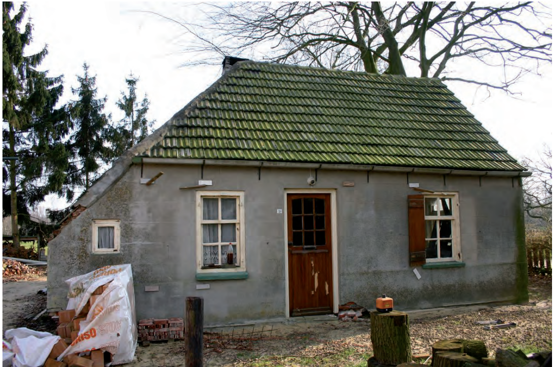
Afbeelding 03: De voorgevel van het pand.