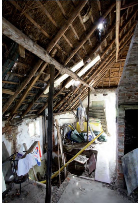
Afbeelding 10: De voormalige linker zijbeuk gezien in de richting van de achtergevel. Restant van de half verdiepte kelder.