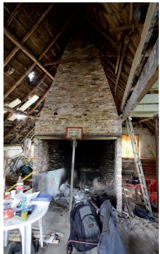
Afbeelding 08: De schouw in de volledig van interieurindeling ontane boerderij.