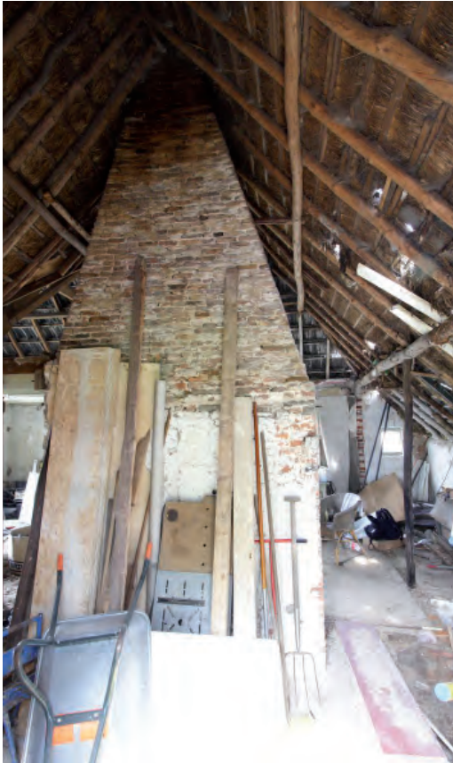
Afbeelding 12: De schouw en het rookkanaal gezien vanuit het voormalige staldeel van de boerderij.