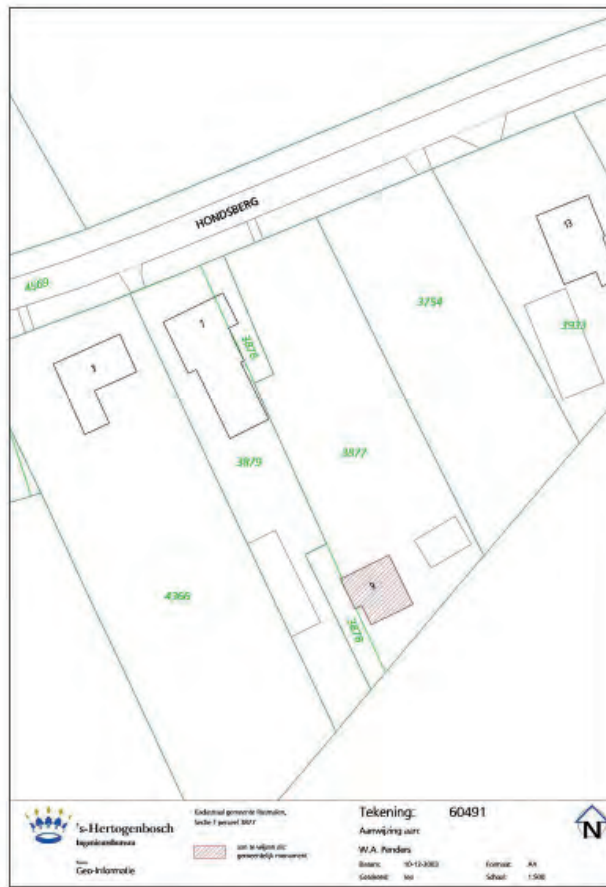
Afbeelding 01: De kadastrale situatie in 2003.