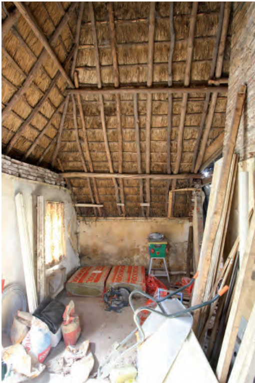
Afbeelding 14: Het voormalige staldeel. Rechts op de foto de achterzijde van de schouw.