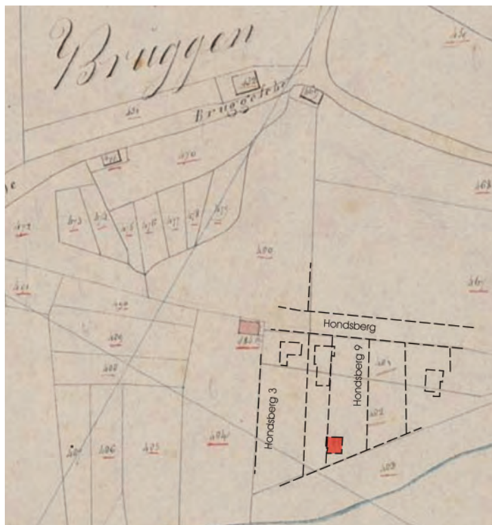
Afbeelding 02: De kadastrale situatie van 2003 geprojecteerd op de situatie in 1832. De straat de Hondenberg ontbreekt nog op de negentiende-eeuwse kaart.