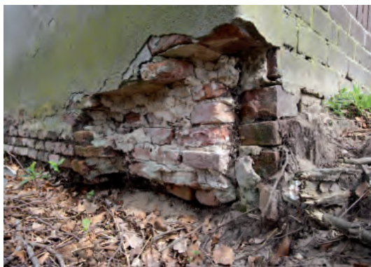
Afbeelding 07: De hoek van de rechter zijgevel met de achtergevel. De achtergevel met machinale baksteen.