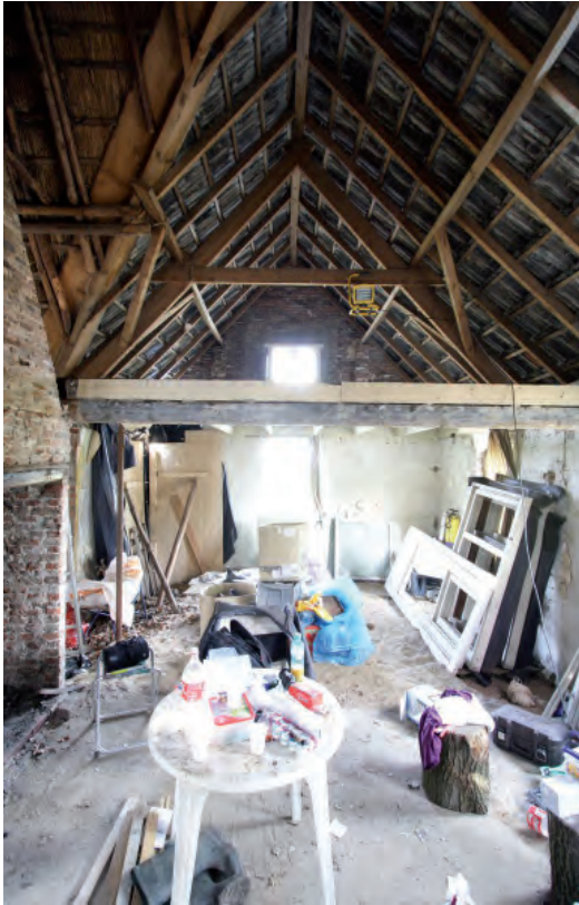
Afbeelding 09: Een blik in de twintigste-eeuwse uitbreiding van de boerderij.