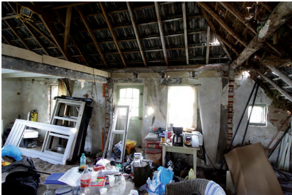
Afbeelding 11: De voorgevel vanuit het pand gezien. Op de voorgevel de afdrucken van twee binnenmuren.