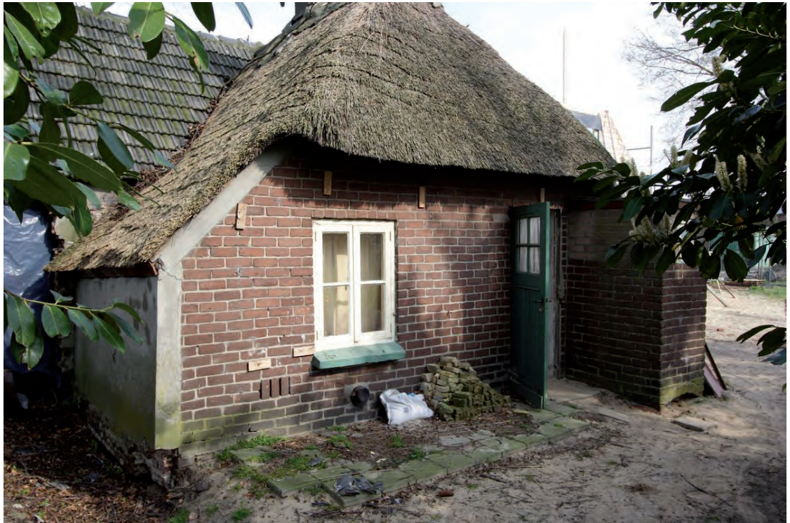
Afbeelding 06: De achtergevel van het pand.